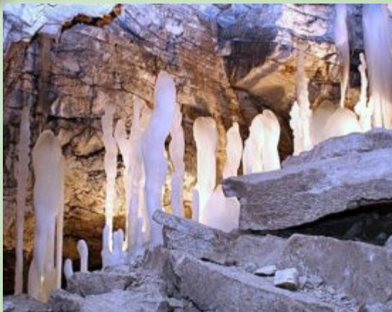
Кунгурская ледяная пещера