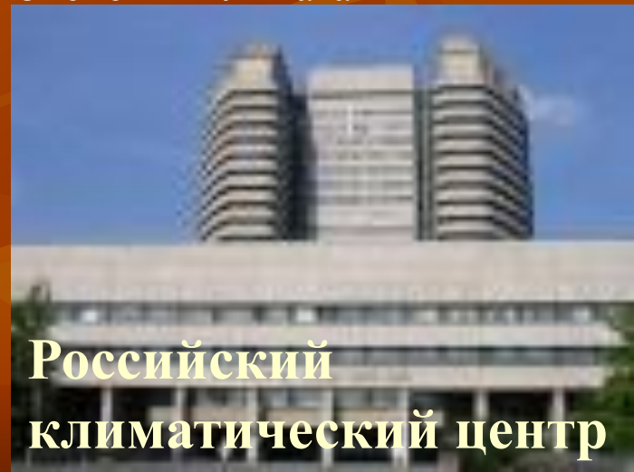
Российский климатический центр

■ Основа мониторинга климата - метеорологические данные. Научные учреждения Росгидромета на основе оперативных наблюдений готовят бюллетени, отражающие изменение ситуации за определенный период. Месячные бюллетени "Данные мониторинга климата" начали выходить в 1984 году, а в 1997-м появился первый годовой бюллетень "Изменения климата России".