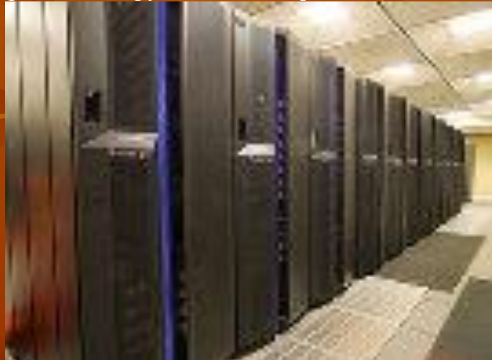
Современные компьютеры для вычисления климата

■ Очевидно, что изменения климата серьезно влияют на хозяйственную деятельность человека в самых разных областях, от сельского хозяйства до энергетики. Чего ждать от повышения среднегодовой температуры - засухи, пыльных бурь или, наоборот, наводнений и подтопления территорий? Чтобы сделать прогноз возможных последствий, нужно в первую очередь располагать точной и надежной информацией. Для этого во всех развитых странах создаются системы мониторинга - непрерывного слежения за климатом. Задача таких систем - собрать и обобщить климатические данные, оценить серьезность текущих изменений и, что очень важно, своевременно довести полученную информацию до руководящих органов и общественности.