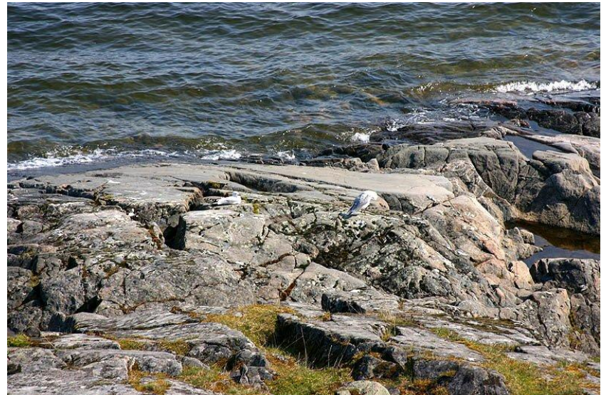
Побережье озера Венерн