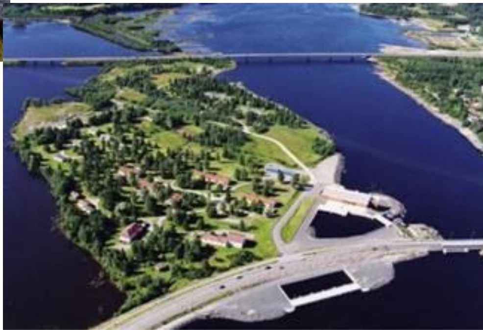
Остров Валлитунсаари (площадь острова 17 га), находящийся в устье реки Кемийоки