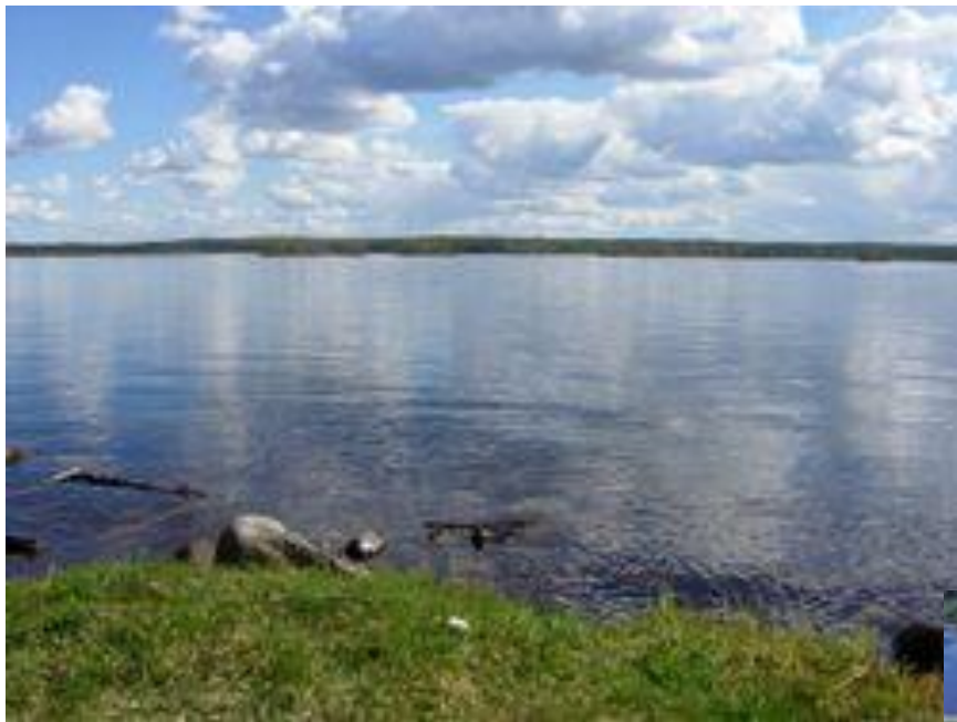
Кемийоки в 30 км от Рованиеми