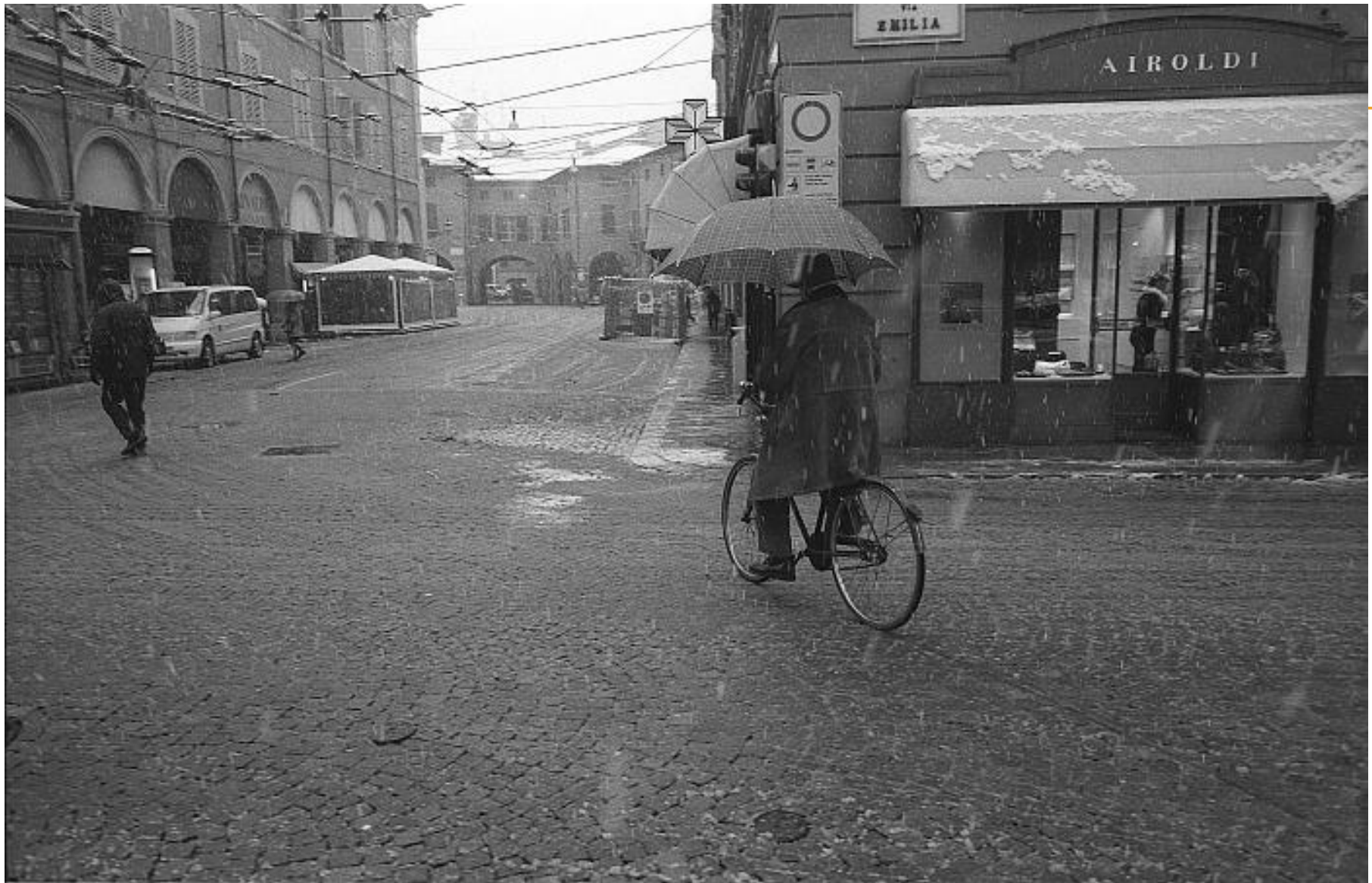
Снег в Италии. Декабрь, 2008.