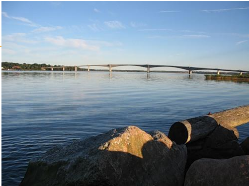
Мост через Венерн