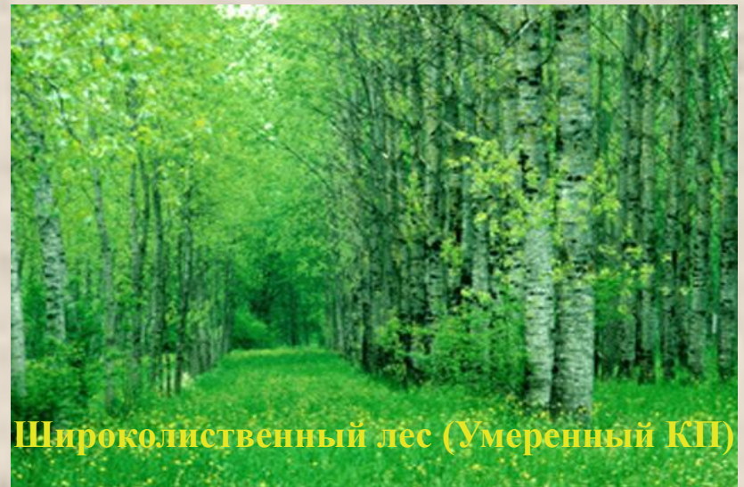
Широколиственный лес (Умеренный КП)