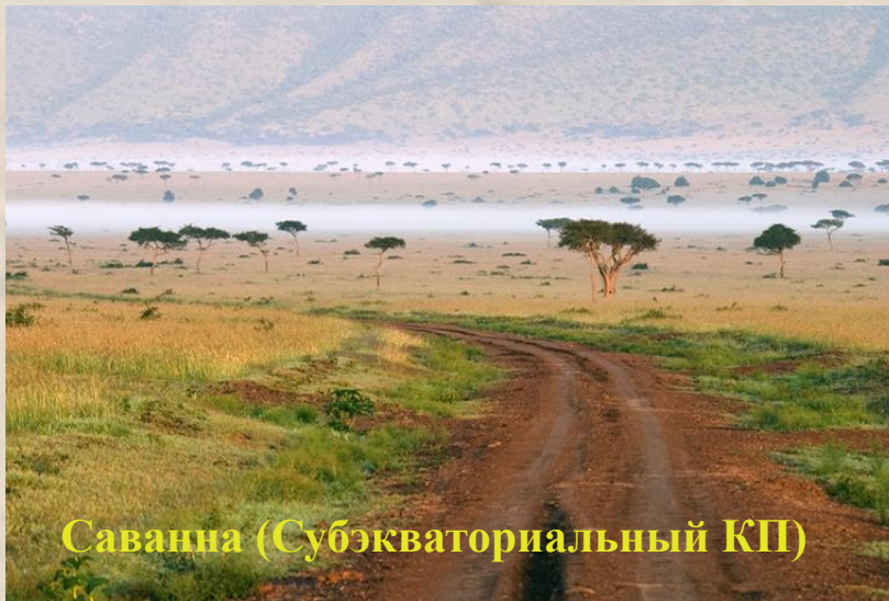
Саванна (Субэкваториальный КП)