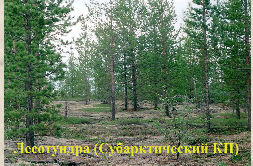
Лесотундра (Субарктический КП)