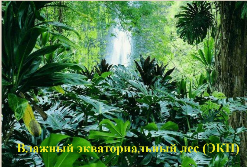
Влажный экваториальный лес (ЭКП)