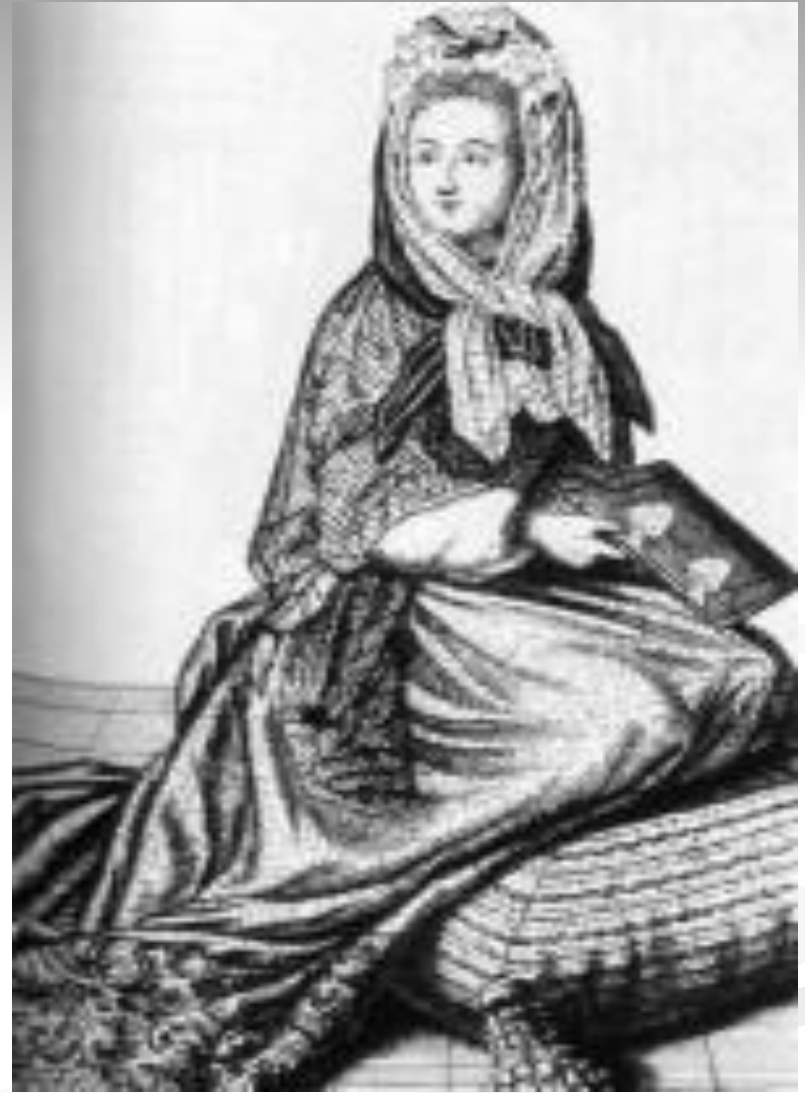
Нац. костюм Франции