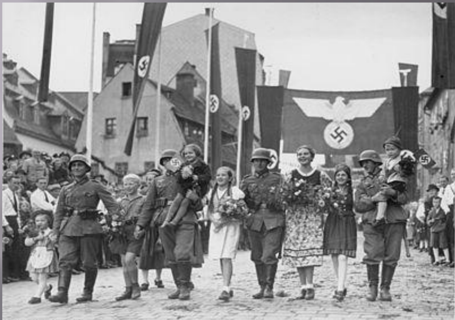
Bundesarchiv, Bild 103-H13158 Foto: a. Ang. 13. Oktober 1938