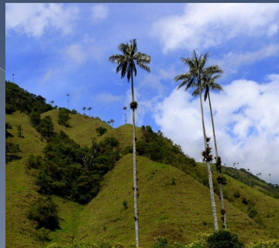
Пальмы Ceroxylon quindiuense