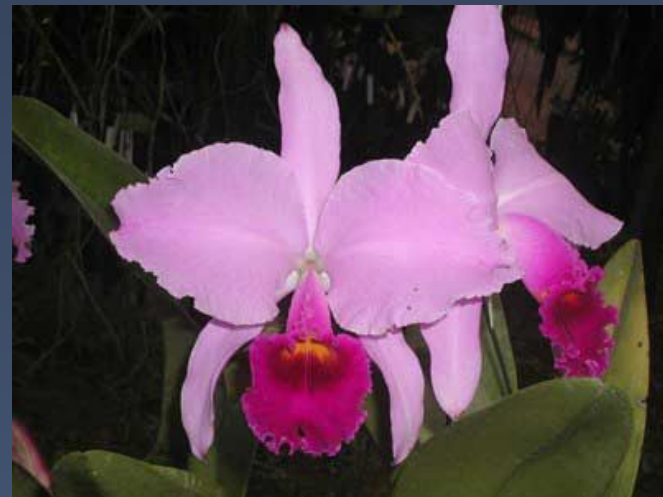
Орхидея Cattleya trianae