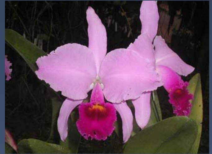
Орхидея Cattleya trianae