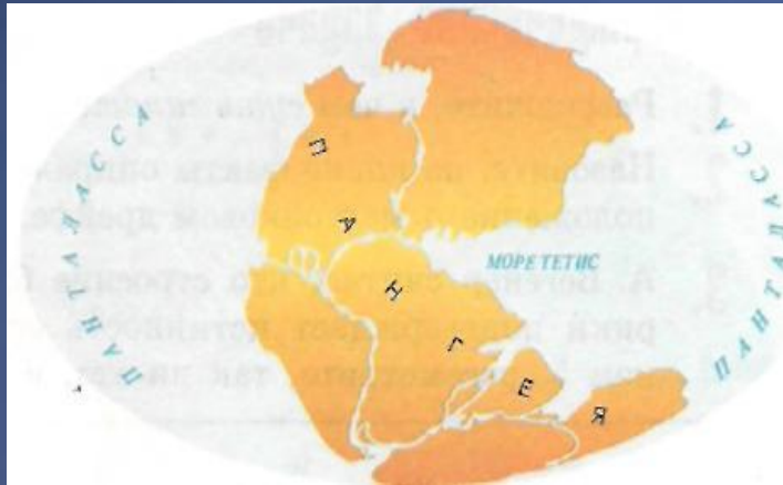
Рис. 2. Поверхность Земли 200 млн лет назад. Названия Пангея и Панталасса происходят от греческих pan — «вся», ge — «земля», talas-sa — «море». Название Тетис — от имени греческой богини моря Thetis