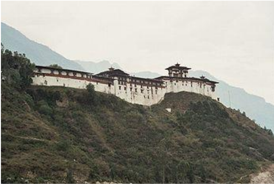
Дзонг Вангди-Пходранг в Бутане.

Дзонги сочетают массивные стены, башни, вереницу внутренних дворов, храмы, административные здания, жильё для монахов. Обычно дзонги расположены в горах, защищённые скалами.