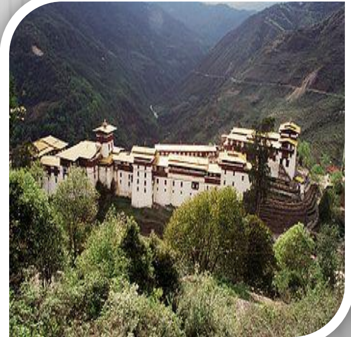
Дзонг Тонгса, Бутан