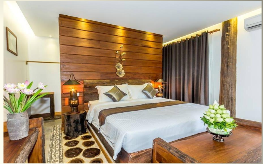
Java Wooden Villa 4* 4800 P