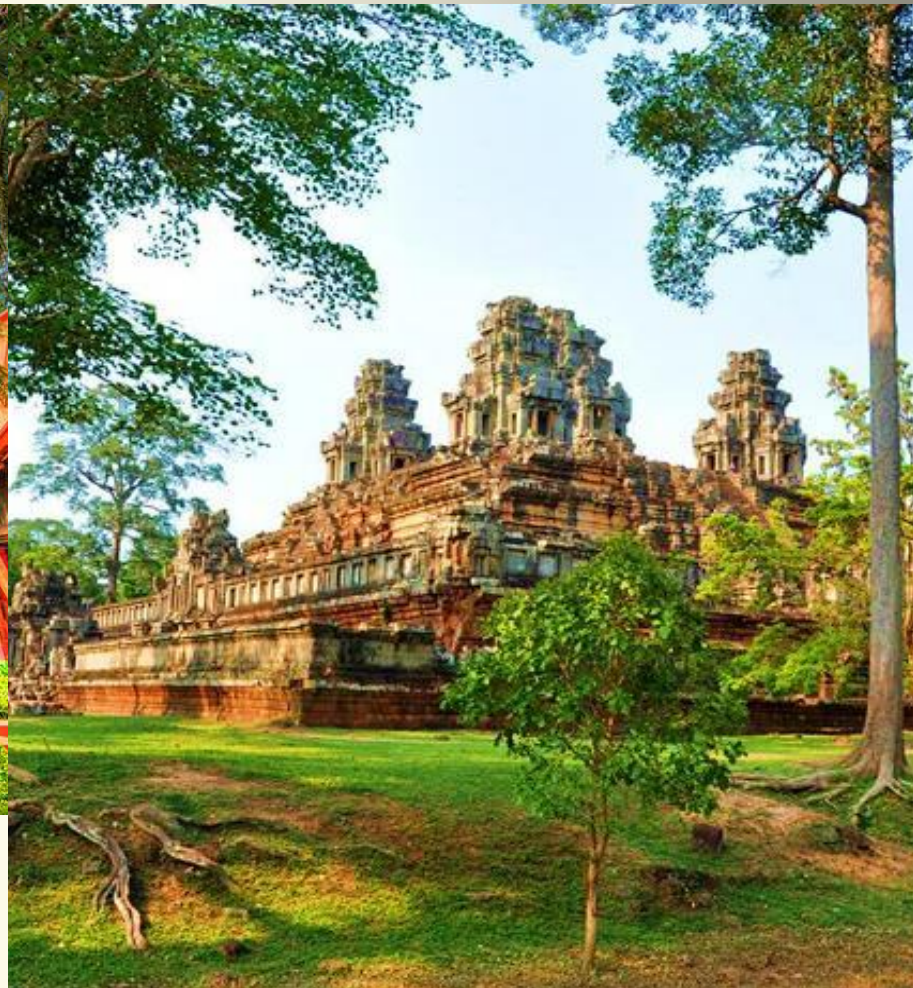
Храм Пном – Да