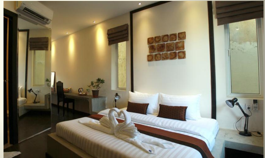
Makk 2* 3100 P