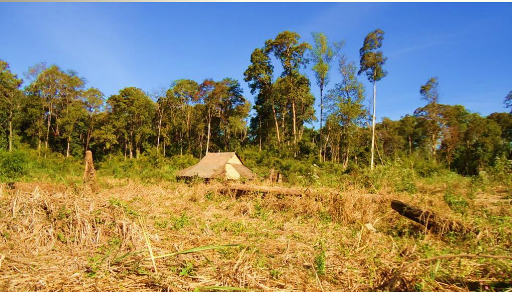
Тропический лес Кабат