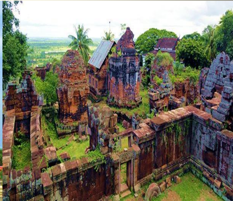
Руины храма Пном Чисор