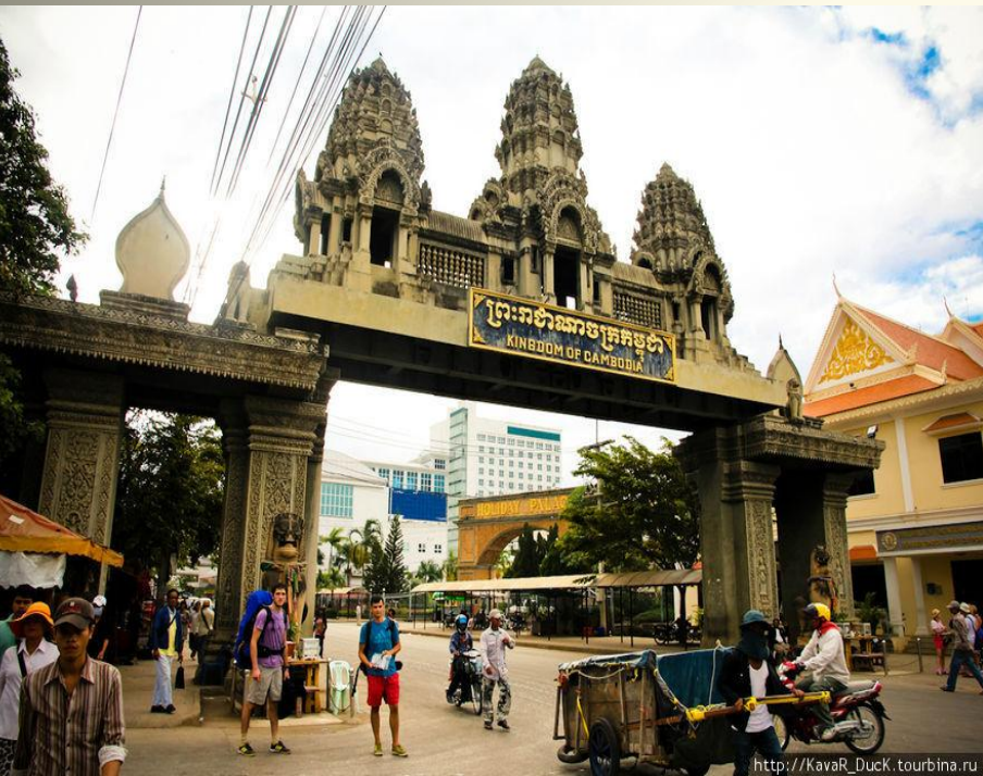
Арка между Таиландом и Камбоджей