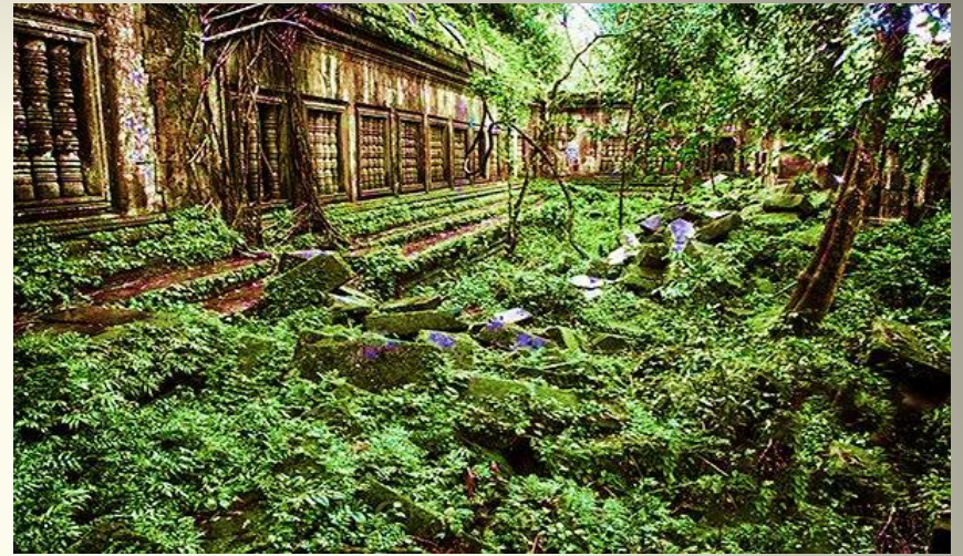
Храм Бенг Меалеа