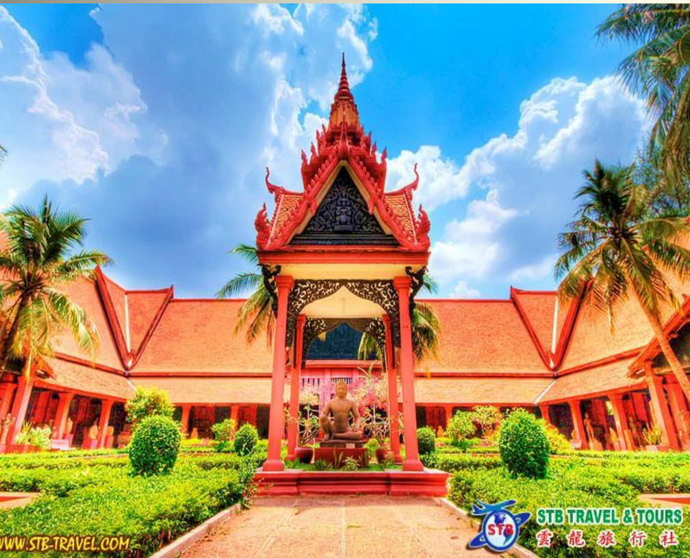
Национальный музей искусств