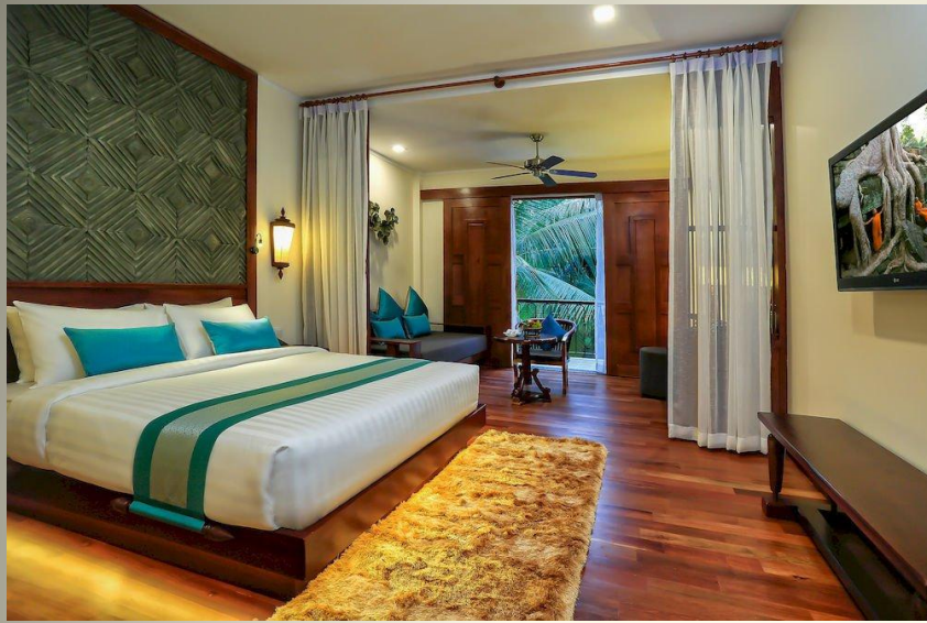
Lotus Blanc Resort 5* 5600 P