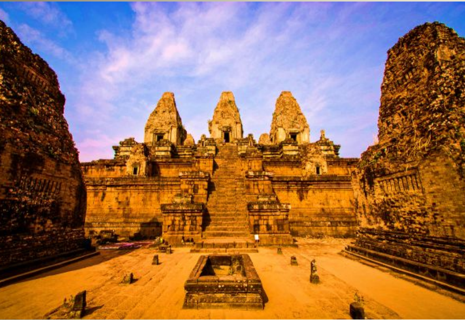
Храм Пре Руп