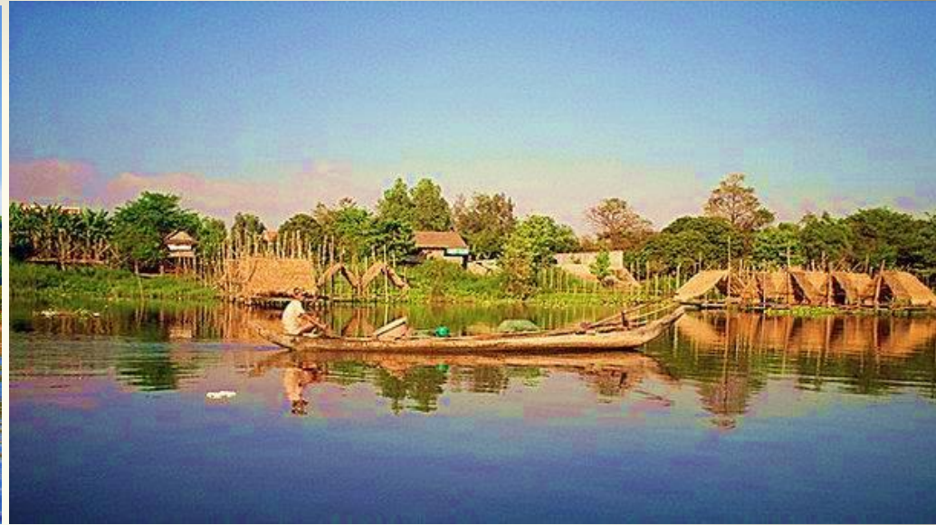
Деревня Киен Сваи