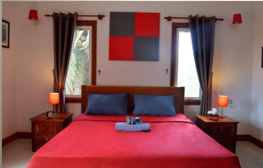
Villa b. Maison Angkor 3* 3400 P