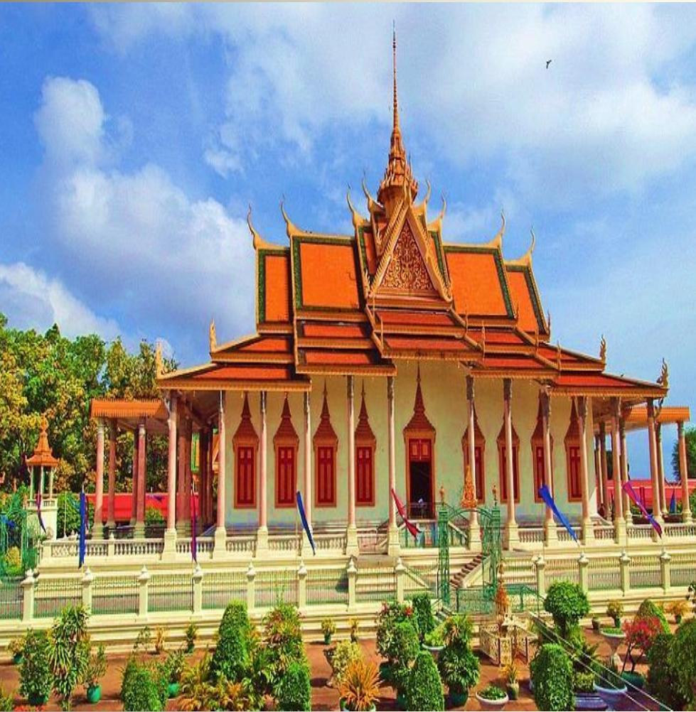
Павильон Чан – Чайя