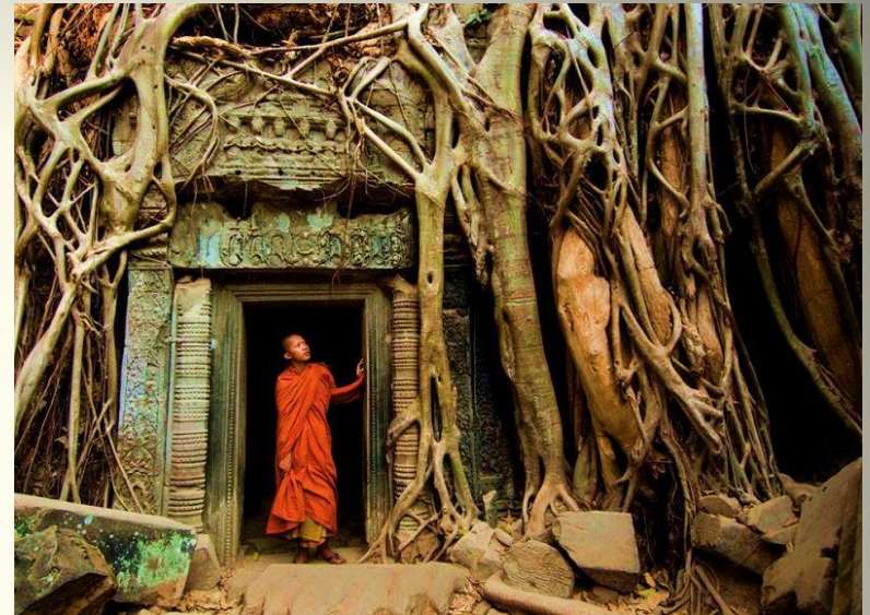
Храм Та Пром