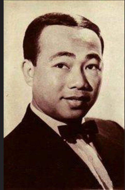
Камбоджийский певец Син Сисамут

Кхмерская традиционная музыка, как и танцы, восходит к временам древней Кхмерской империи и несёт заметное влияние индийской музыки [27] . В древних рисунках сохранились изображения танцев, исполнявшихся в честь монархов, такие как танец Апсара и музыкантов, аккомпанирующих танцовщицам. Из народных форм музыки известны «чапей» и «а яй». Первая из них популярна среди старшего поколения и чаще всего исполняется одним человеком на камбоджийской гитаре (чапей), который в промежутках между музицированием декламирует тексты