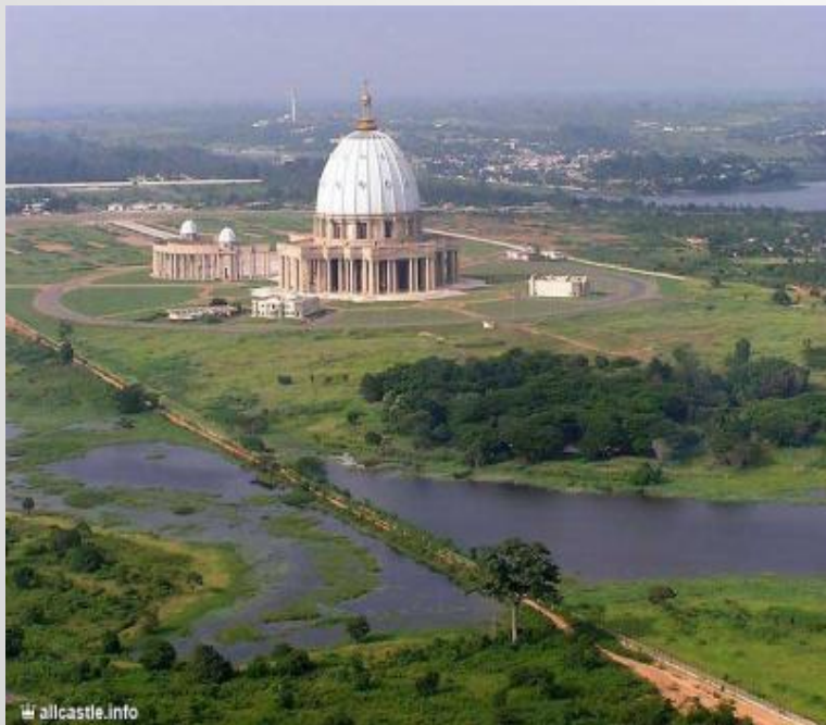
СОБОР СВЯТОГО ПАВЛА