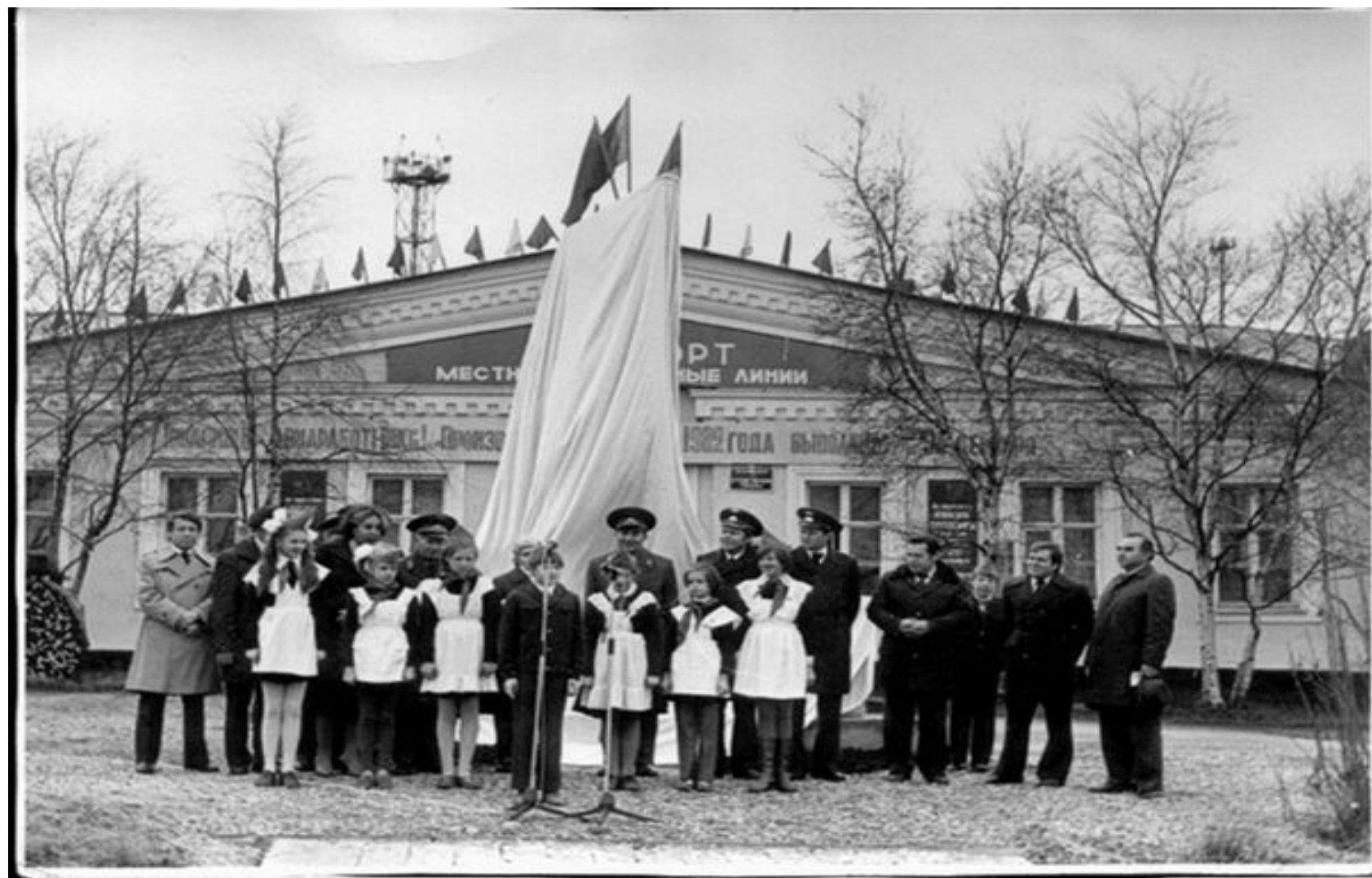
Торжественное открытие памятной стелы воинам-авиаторам 7 октября 1982г.