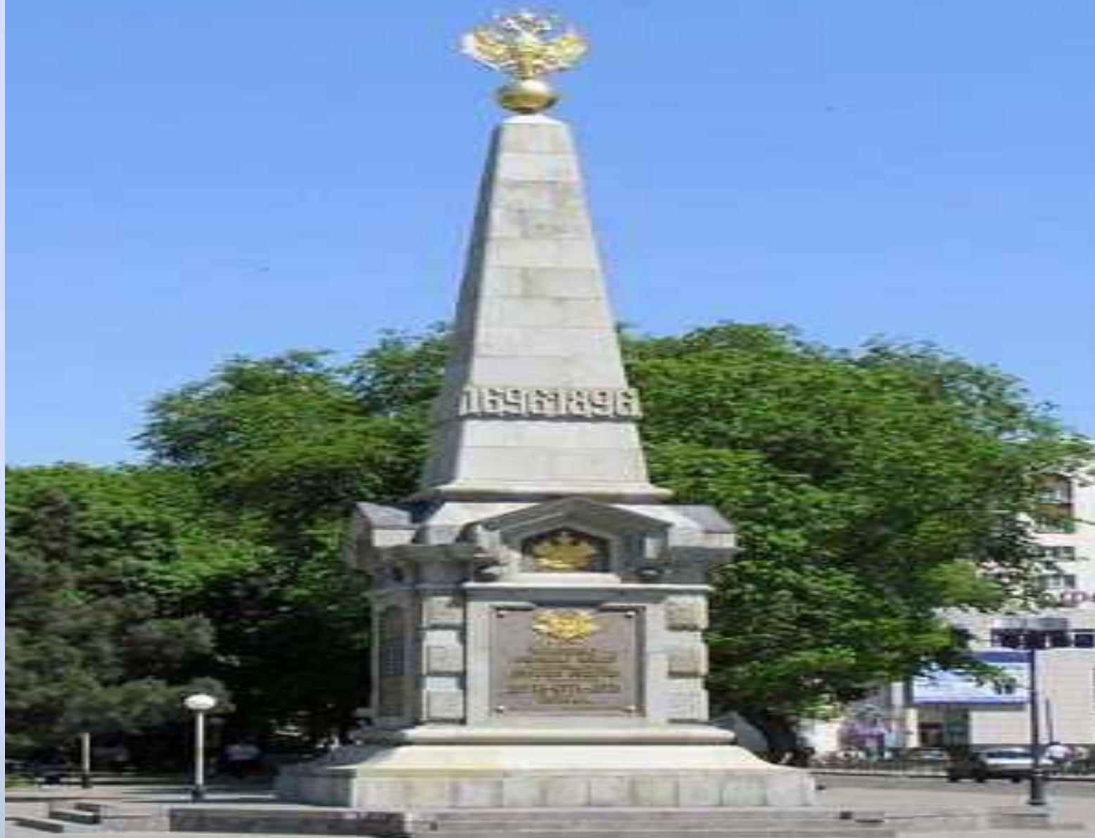
Памятник в честь 200-летнего юбилея Кубанского казачьего войска.