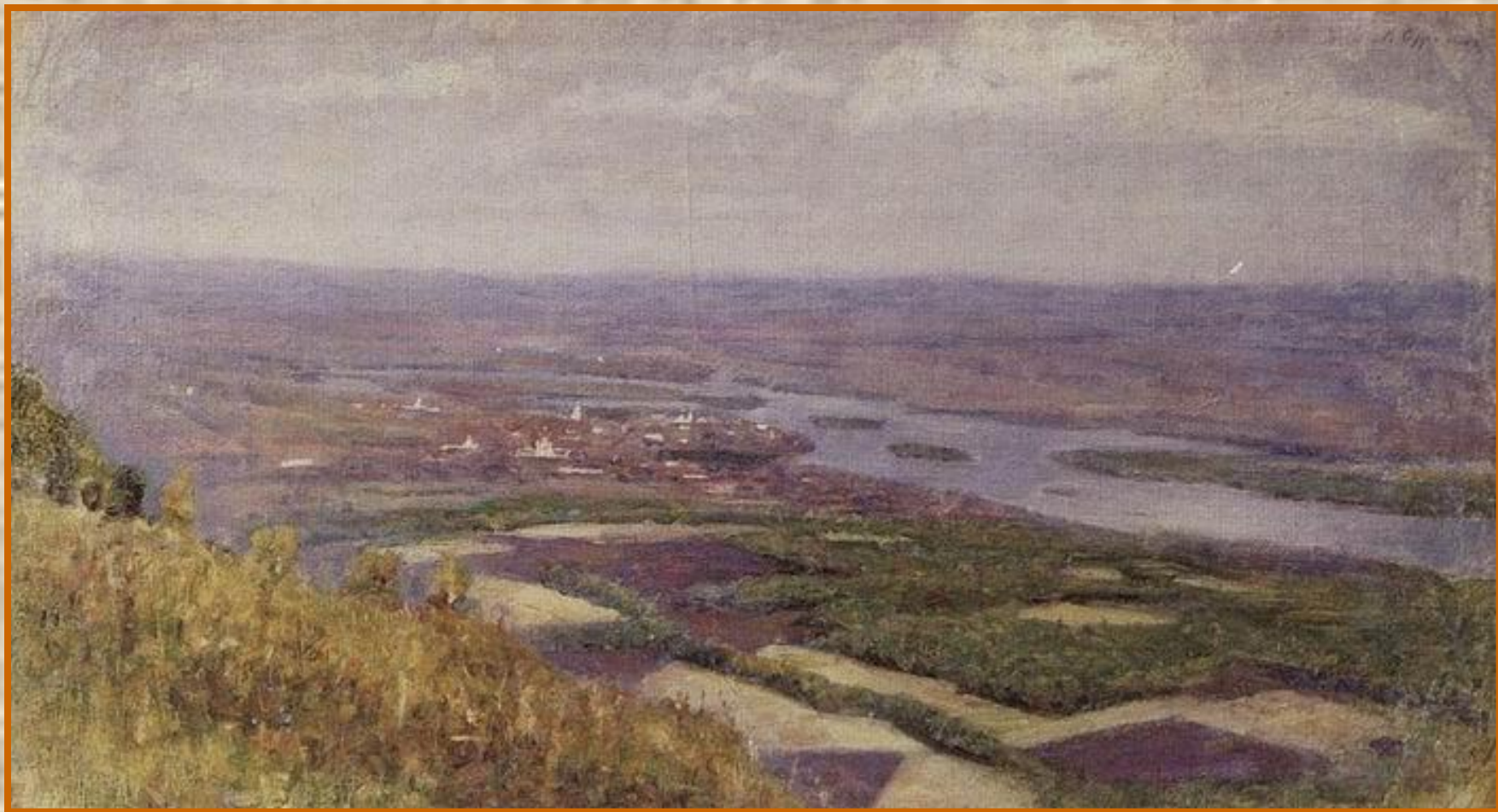
Вид на Красноярск с горки. 1890-е гг.