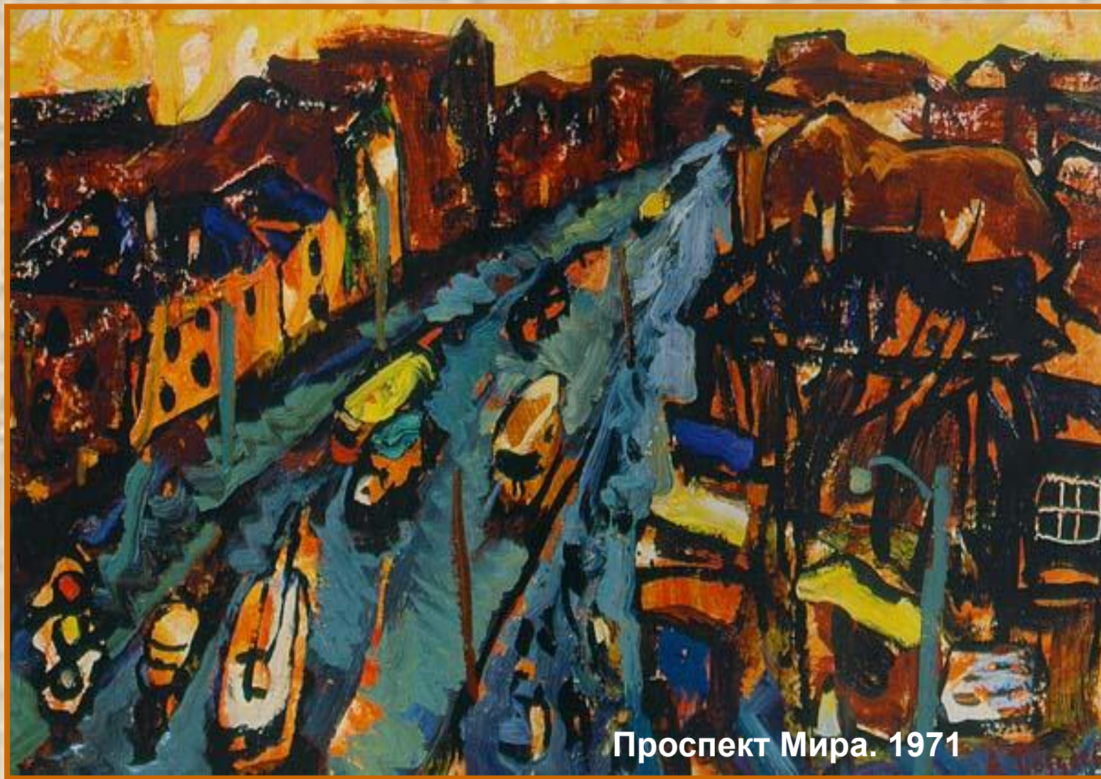
Проспект Мира. 1971