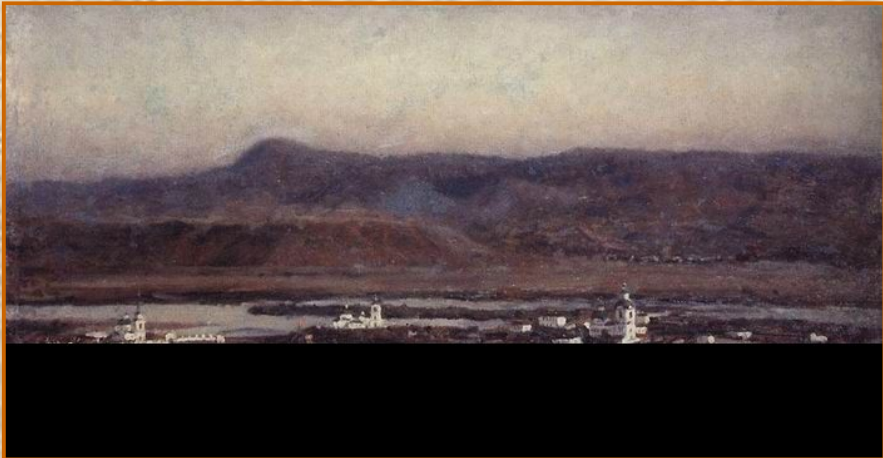
Старый Красноярск. 1914