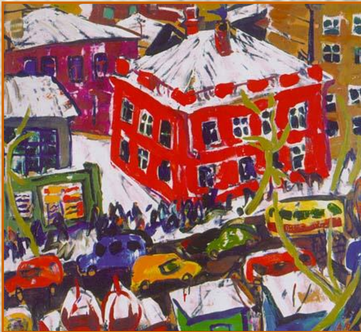
Пейзаж с красной крышей. 1968