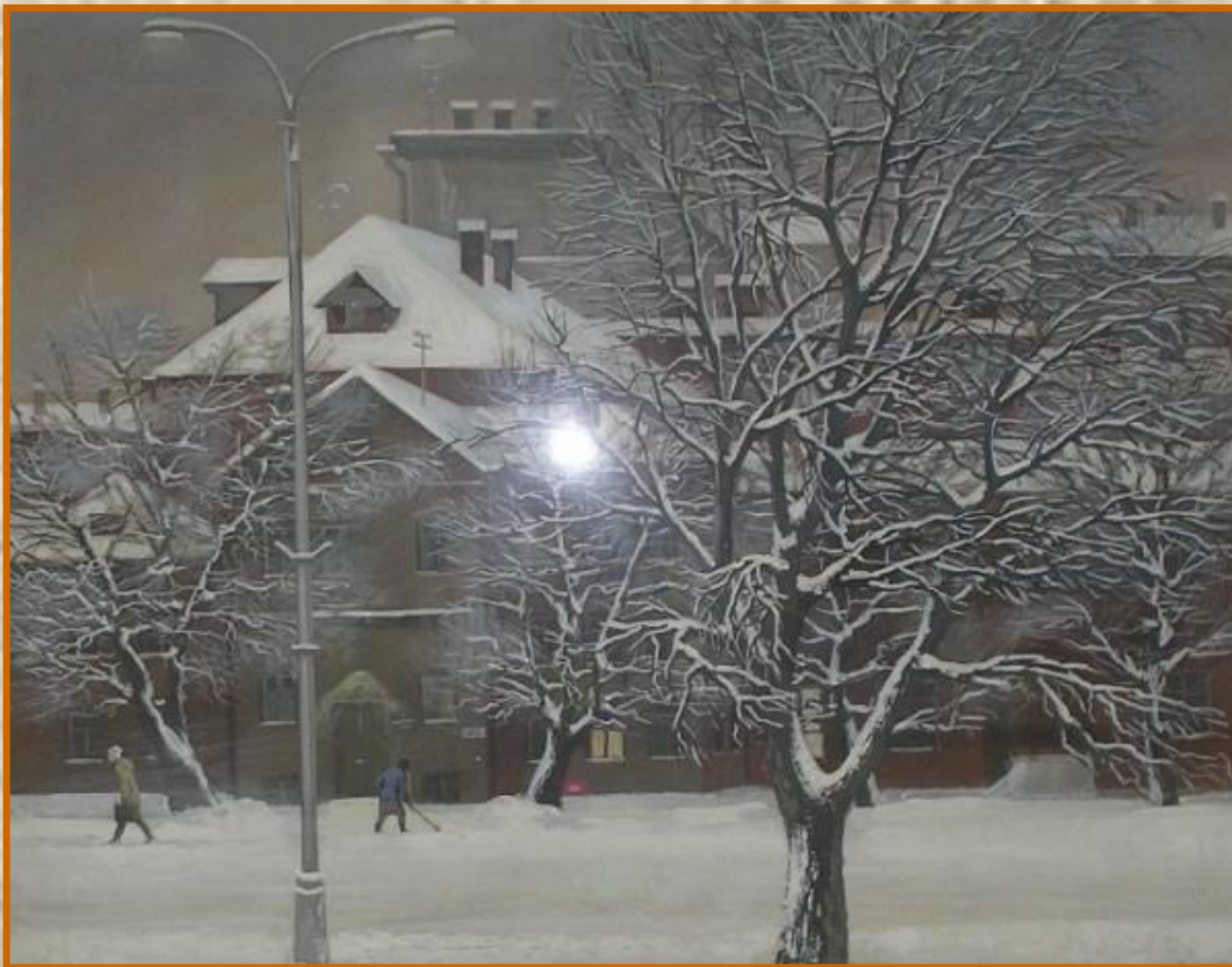
Старый город. 1986, бум., смеш.тех.