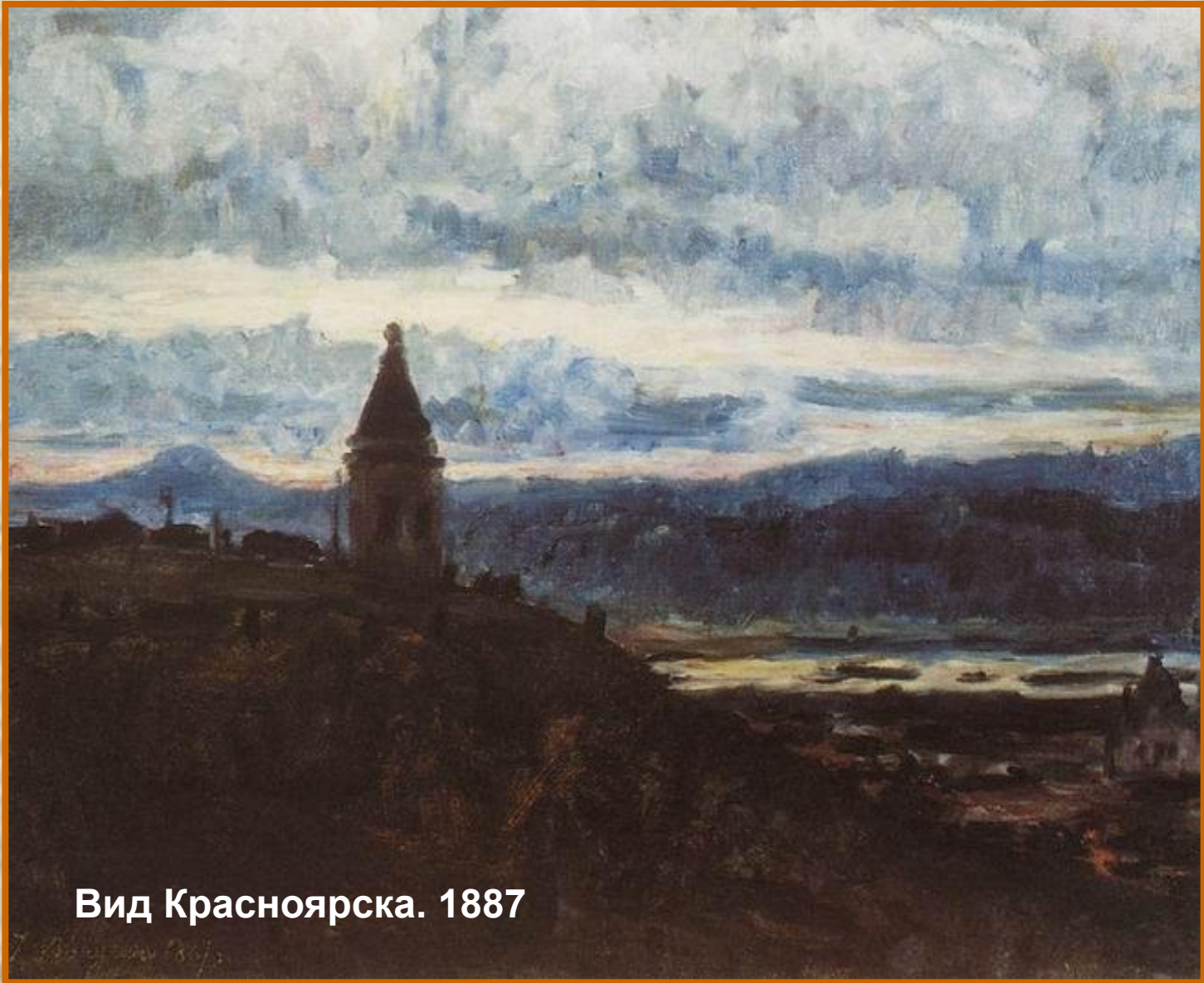
Вид Красноярска. 1887