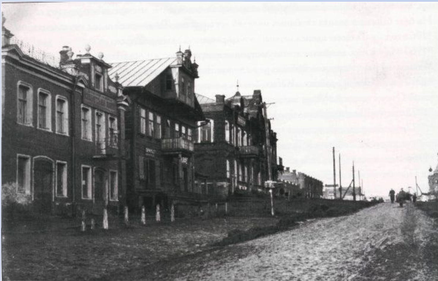
Московская улица (ныне - Салтыкова-Щедрина). 1920-е гг.