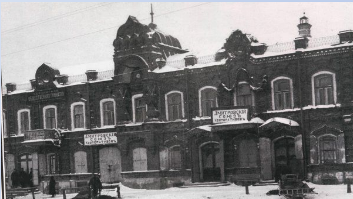
Бывший дом купца Киселева (ныне - библиотека). 1920-е гг