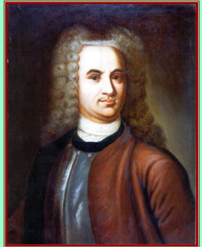
Татищев В.Н. 1686 - 1750

Удачную точку на карте Урала нашёл капитан артиллерии Василий Никитич Татищев для строительства Егошихинского завода. А на месте этого завода вырос один из крупнейших городов Урала.