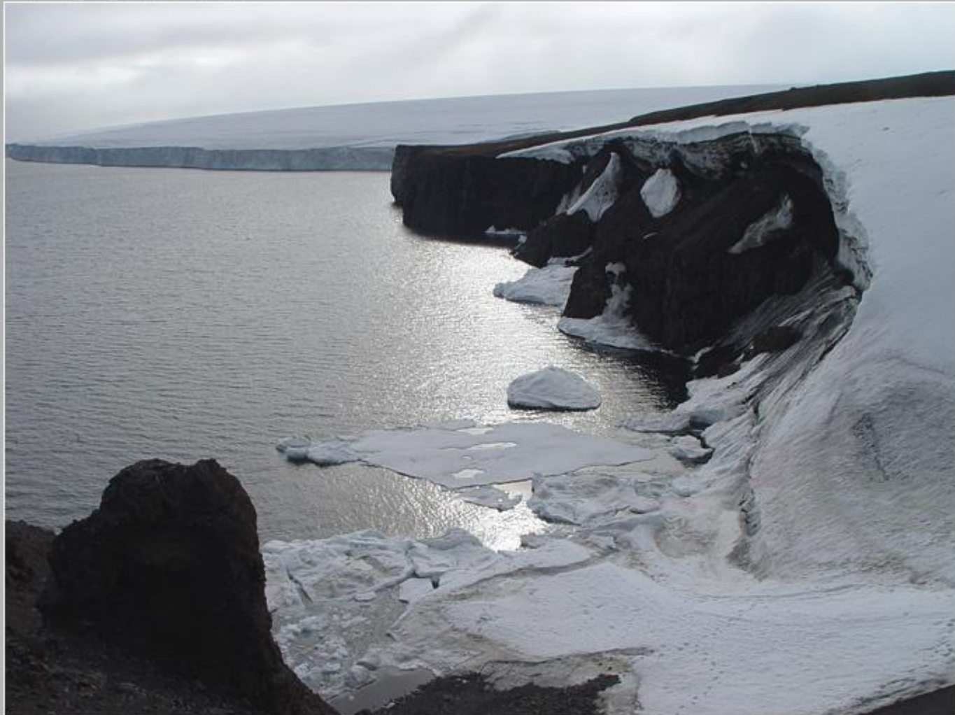
Арктика-2007. 26 рейс НЭФ Академик Федоров. Земля Франца Иосифа. Остров Рудольфа. У мыса Флигели.