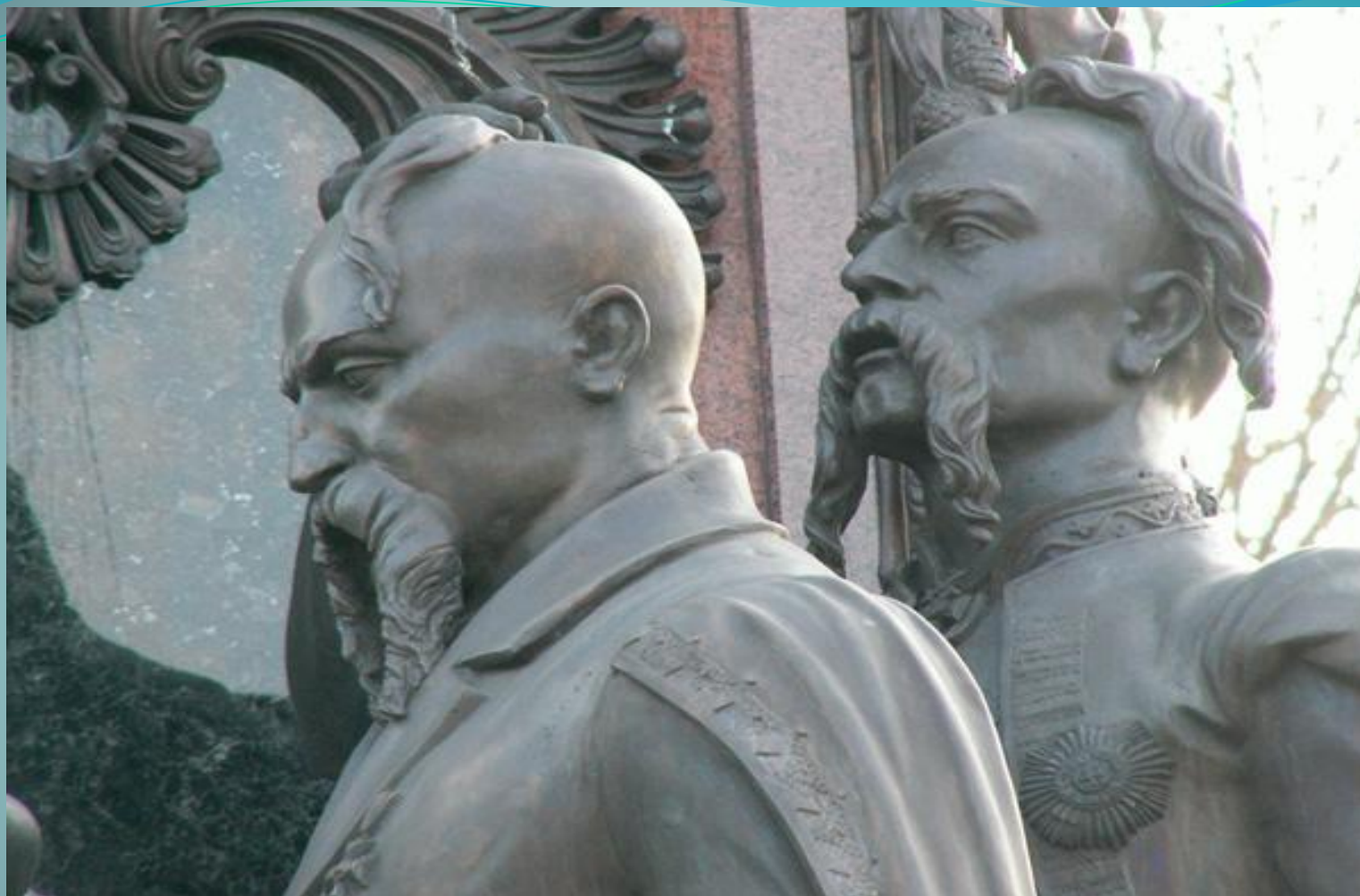
Сидор Белый и Захар Чепига