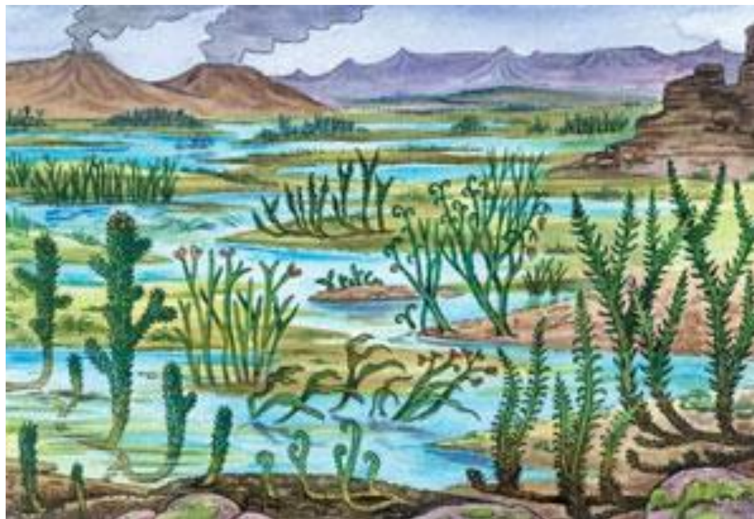
Рис. 1. Первые растения суши (400 млн. лет назад)

В.И. Вернадский писал, что на земной поверхности нет химической силы более постоянно действующей, а потому и более могущественной по своим последствиям, чем живые организмы, взятые в целом. За миллиарды лет фотосинтезирующие организмы (рис. 1) связали и превратили в химическую работу огромное количество солнечной энергии. Часть ее запасов в ходе геологической истории накопилась в виде залежей угля и других ископаемых органических веществ – нефти, торфа и др.