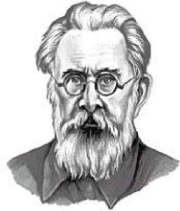
В. И. Вернадский (1863-1945)

Выдающийся русский ученый Академик, основоположник науки геохимии Создал учение о биосфере Земли.