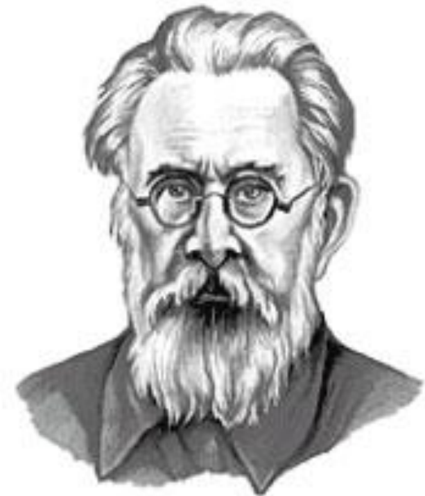
В. И. Вернадский (1863-1945)