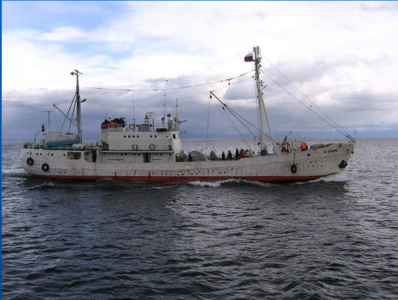
Научно-исследовательское судно «Верещагин»