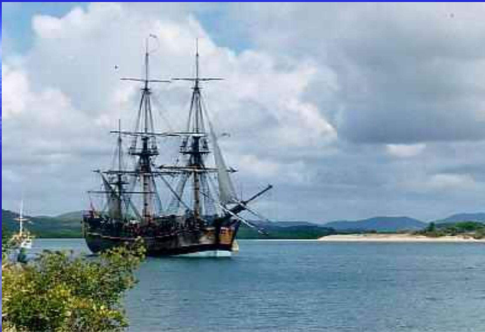
Корабль Джеймса Кука