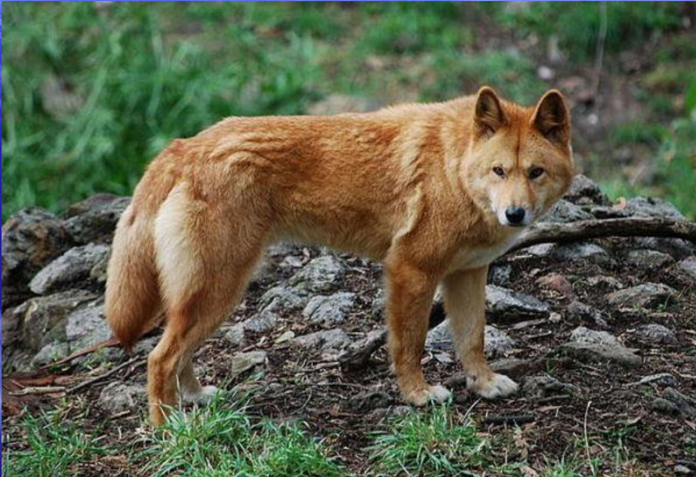
Дикая собака Динго