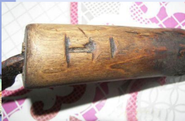
РОДОВЫЕ ЗНАКИ КОМИЦЫСЫ)