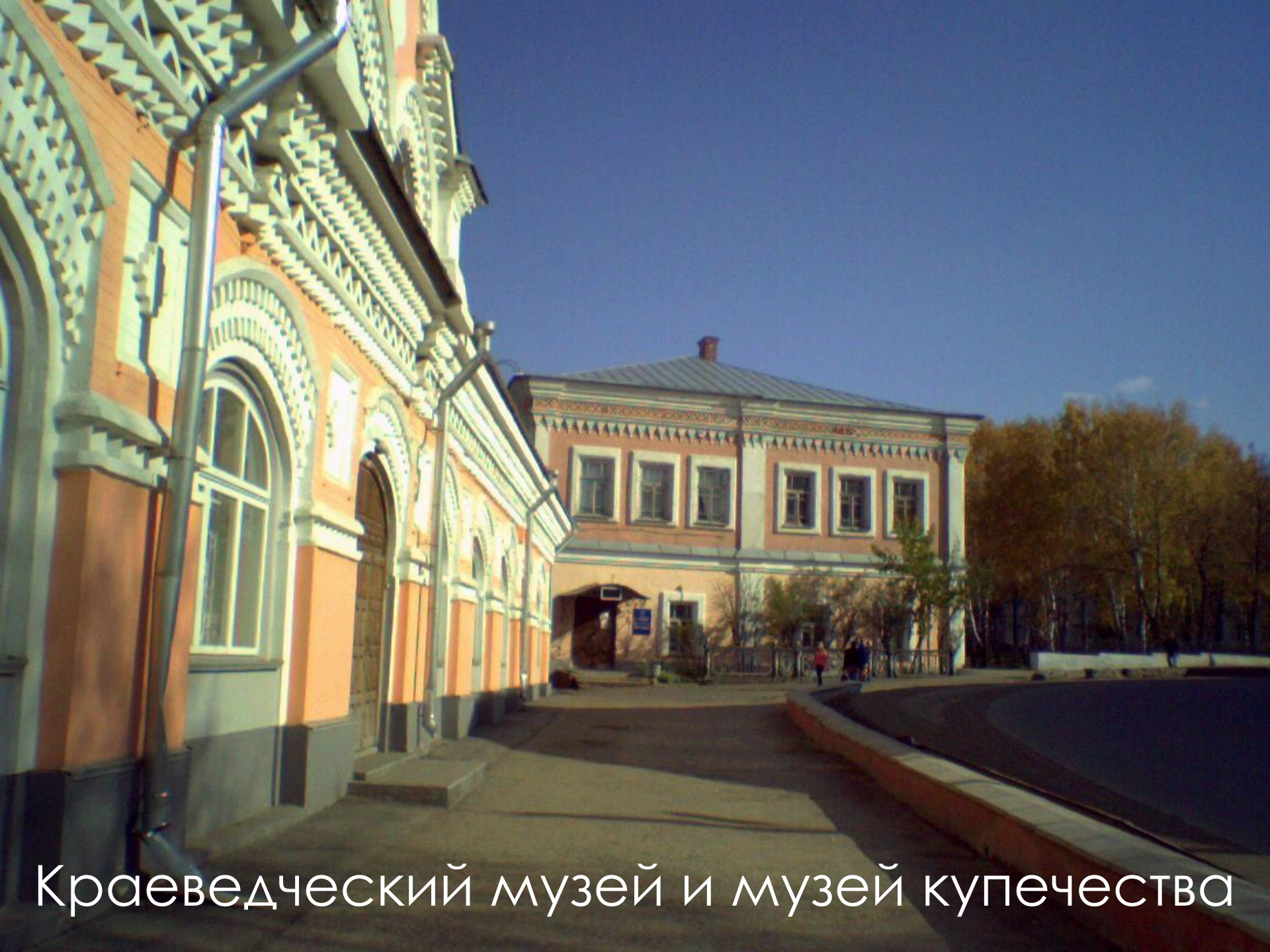
Краеведческий музей и музей купечества