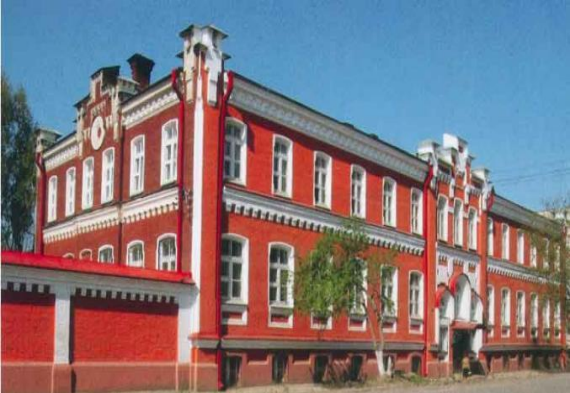
Кунгурское педагогическое училище