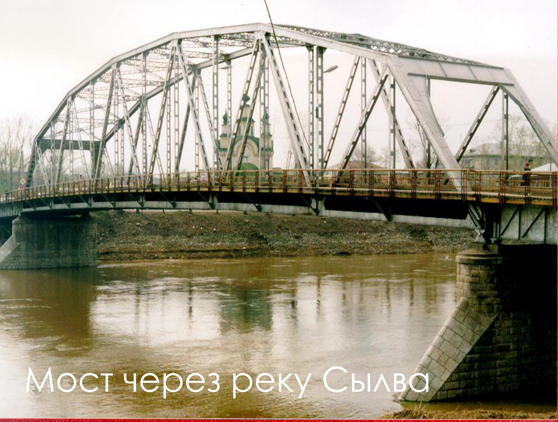
Мост через реку Сылва