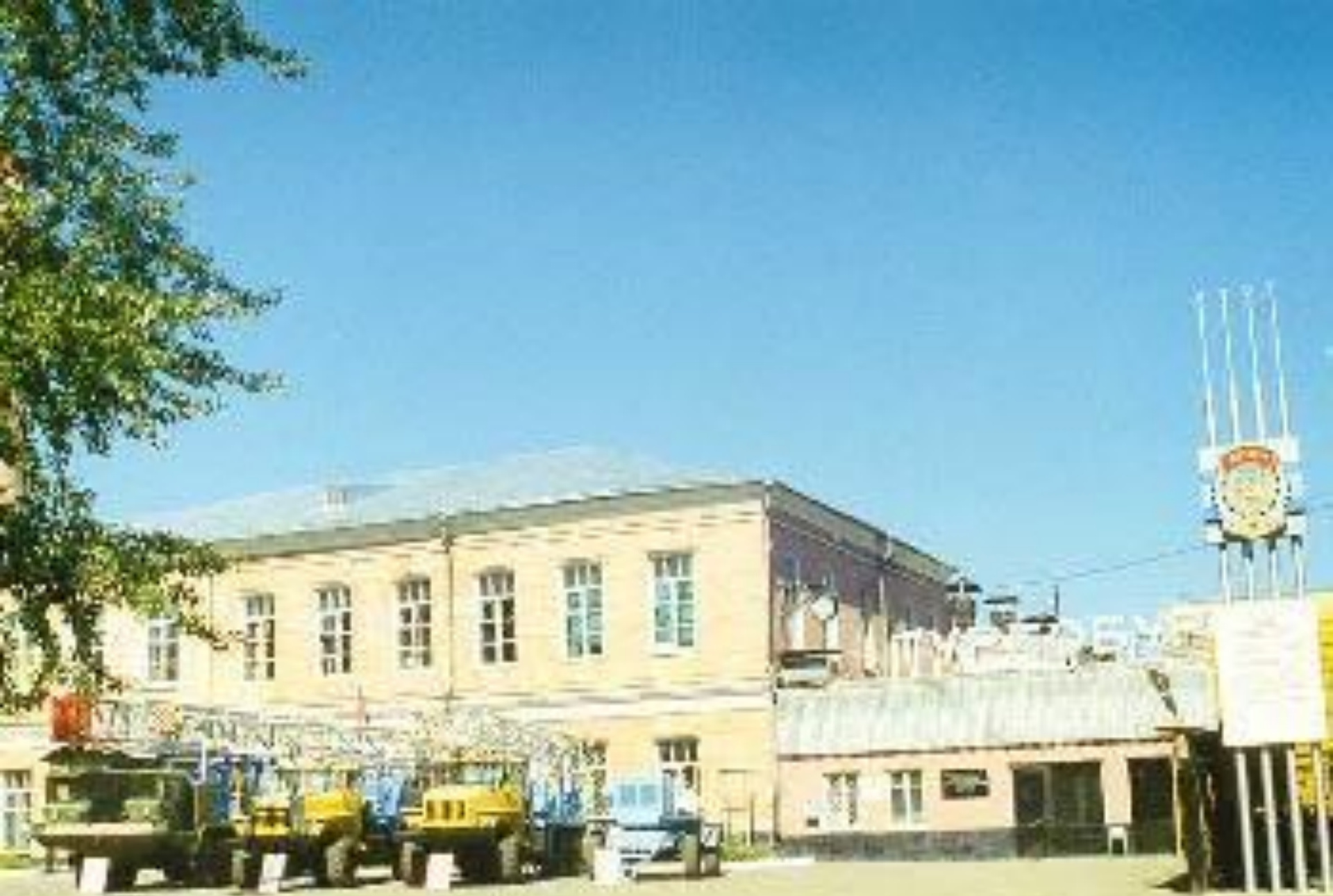
Ку́нгу́рский машиностро́ительный завод