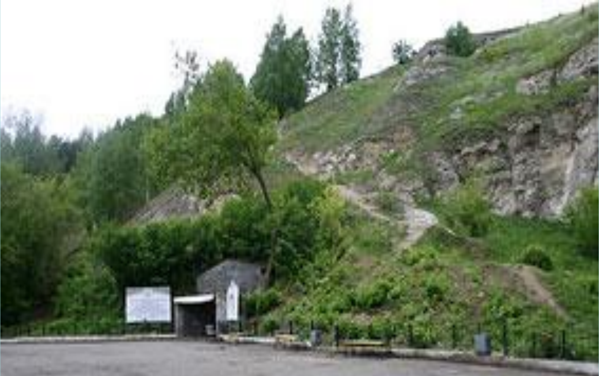
Вход в ледяную пещеру