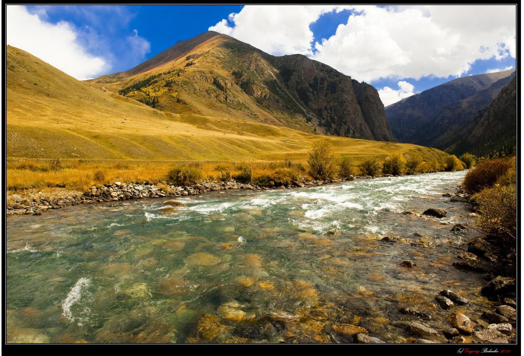
Джунгарский Алатау. Пограничная река Хоргос.