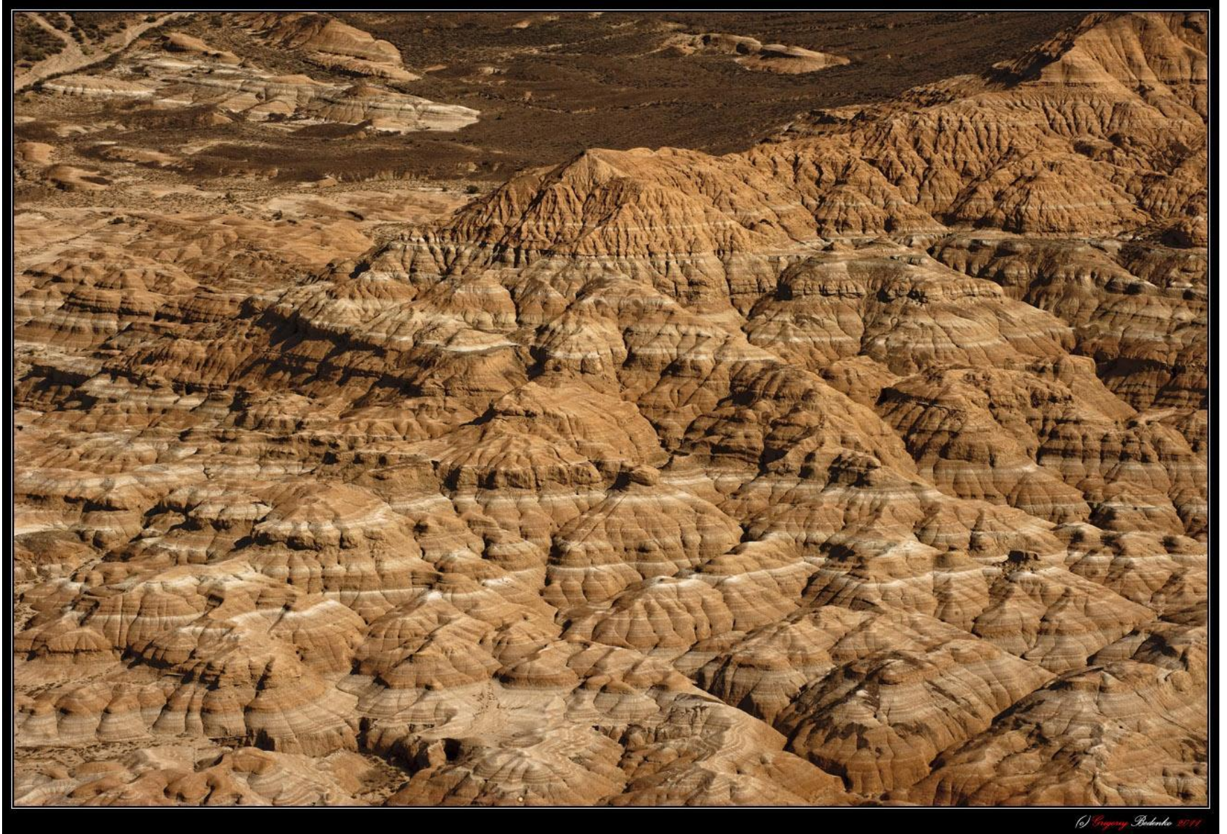
Казахстанский вариант "Марса на Земле". Гибридные структуры из песчаника и известняка в низовьях реки Чарын.