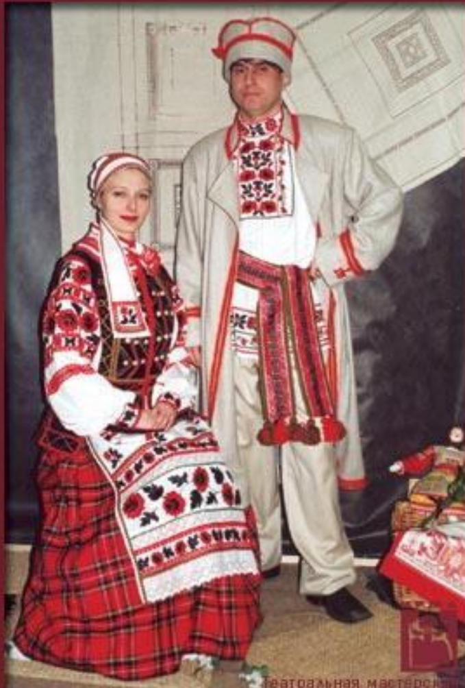
Театральная мастерская "Белорусский" г.Мирный (художник Н.Студенова)