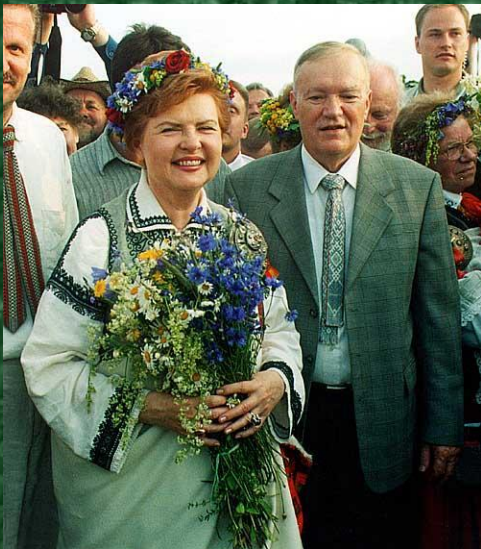
президент Латвии Вайра Вие-Фрейберга