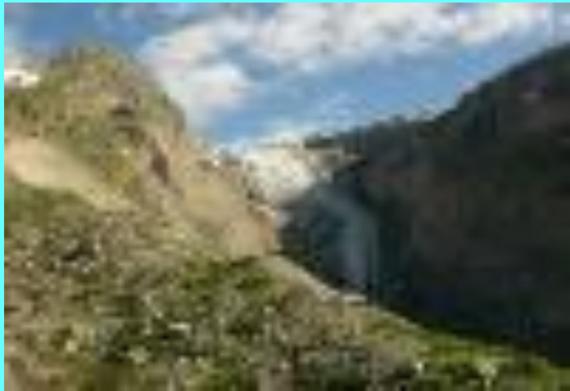
Язик льодовика Азау