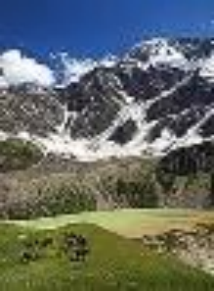
Озеро Донгузорункель під льодовиком Сімка