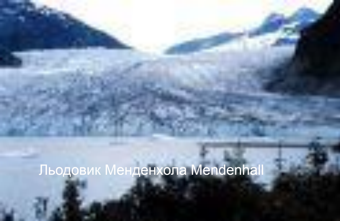
Льодовик Менденхола Mendenhall