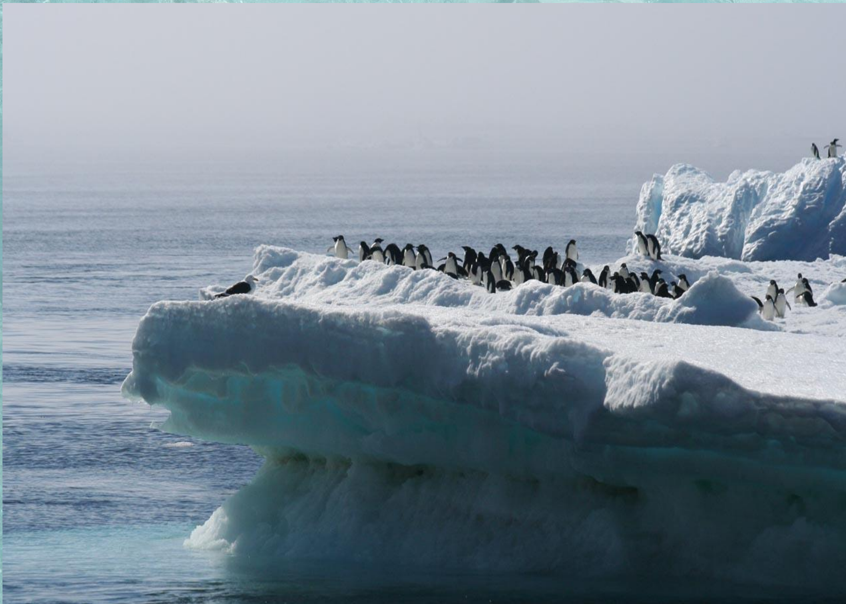
Пингвины на айсберге