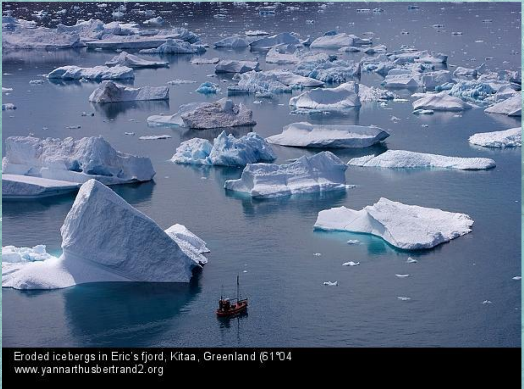
Eroded icebergs in Eric's fjord, Kitaa, Greenland (61°04

Рыболовная лодка среди тающих айсбергов в фьорде Эрика. Гренландия