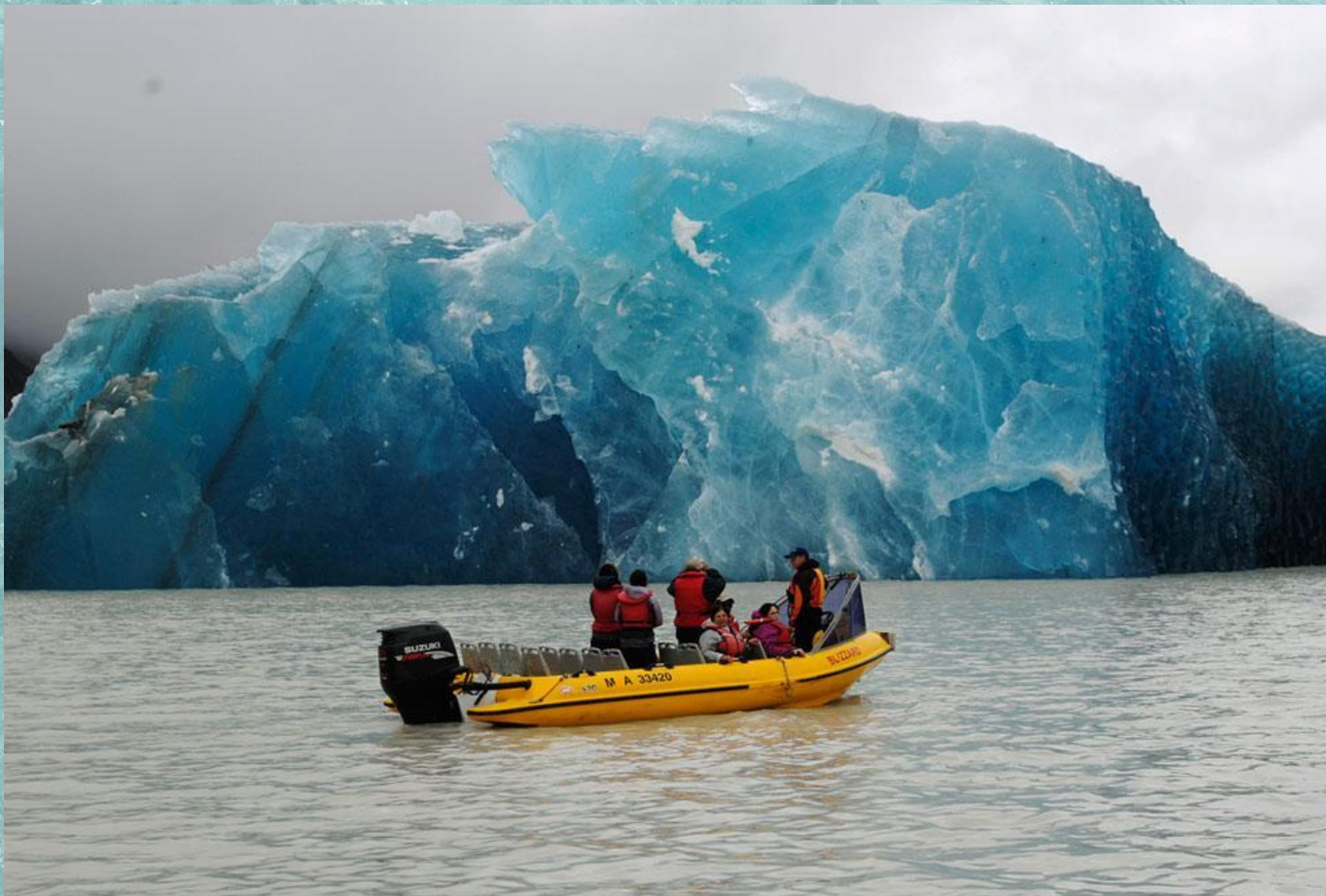
Айсберг, возраст которого более 1000 лет