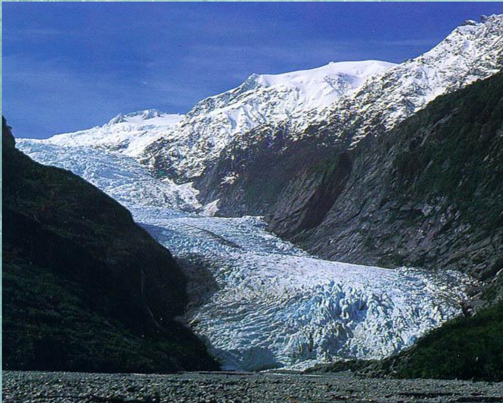
Ледник Франца-Иосифа. Новая Зеландия