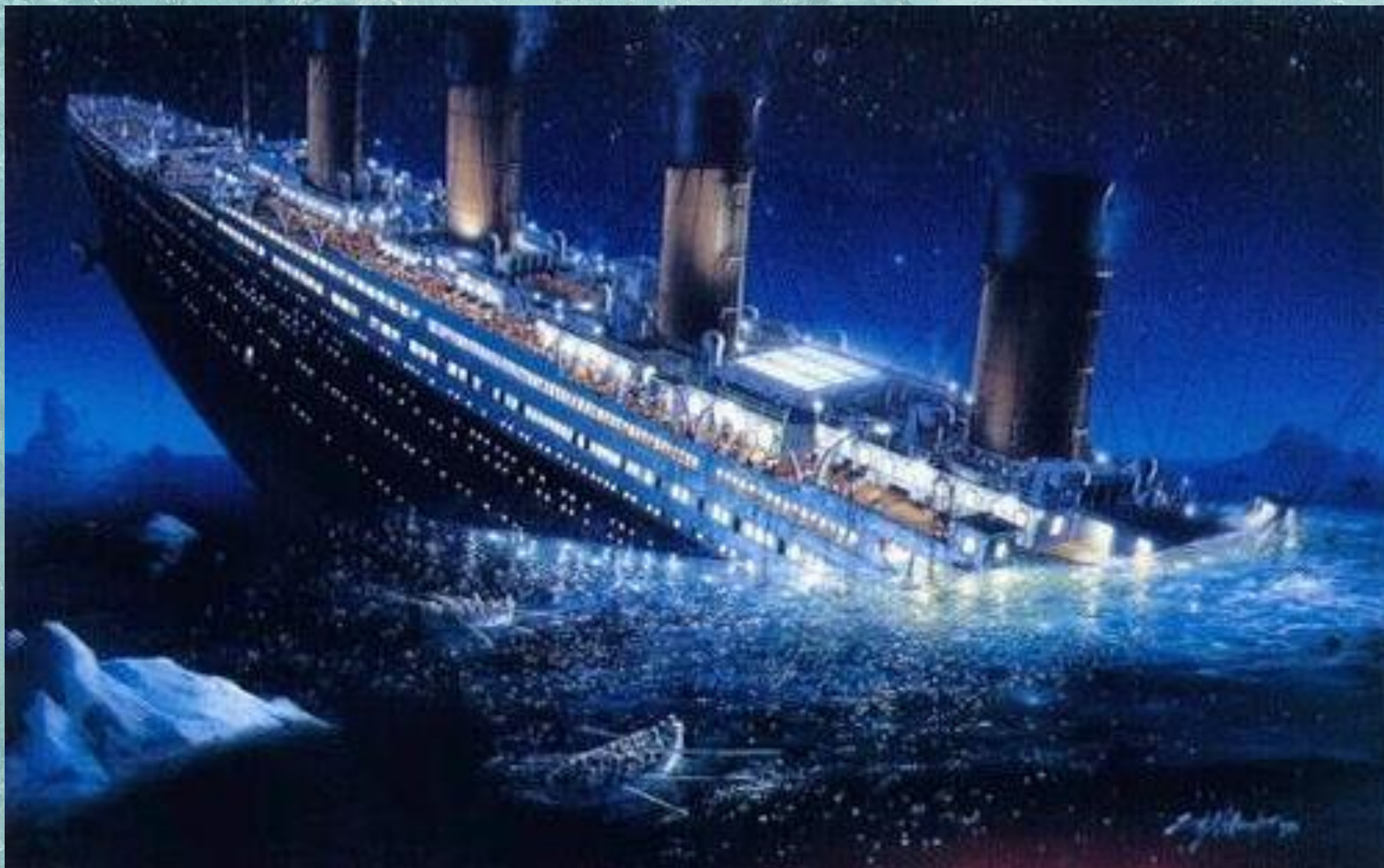
Гибель «Титаника» в 1912 году