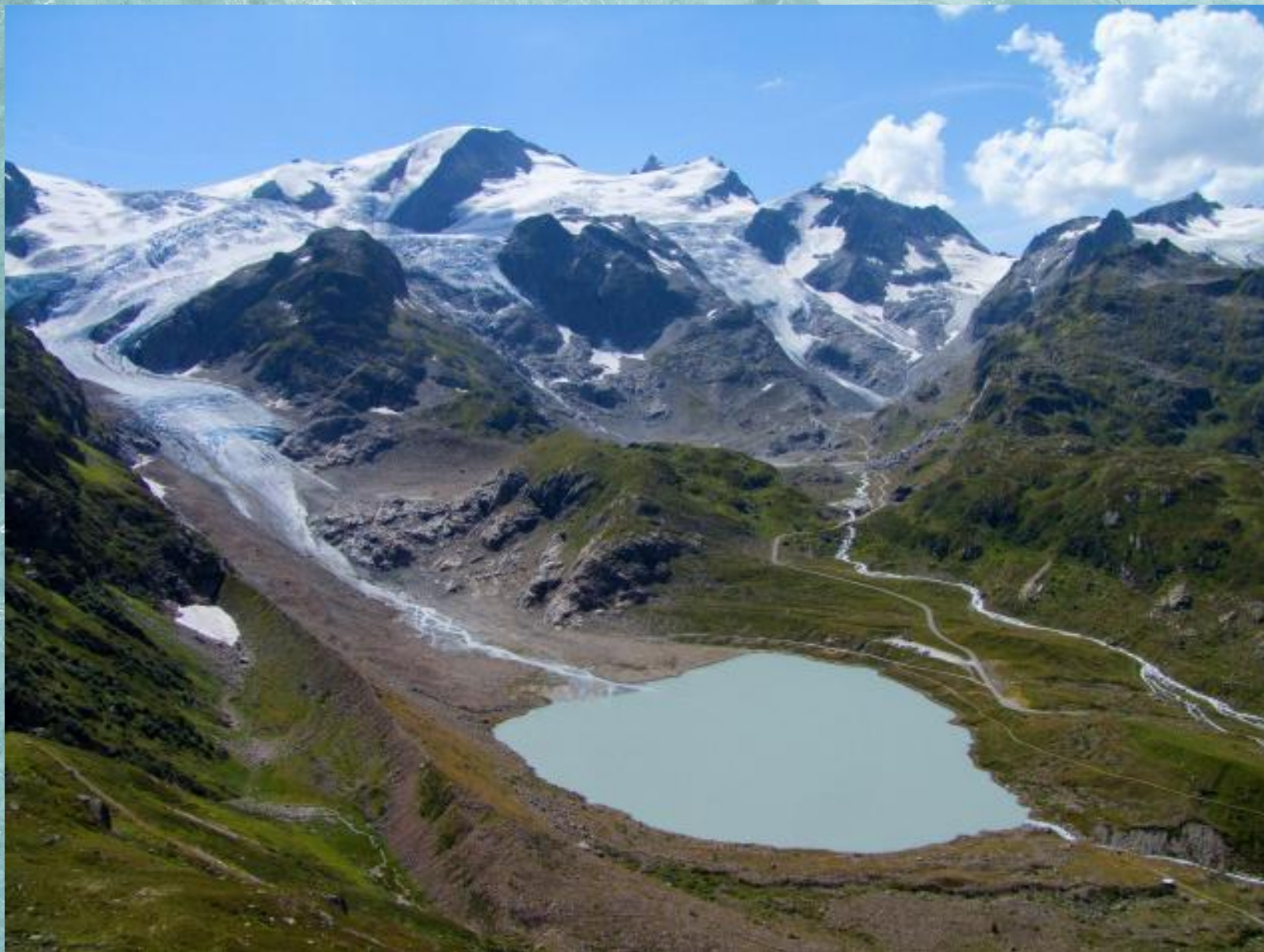
Ледник Обераар. Швейцария