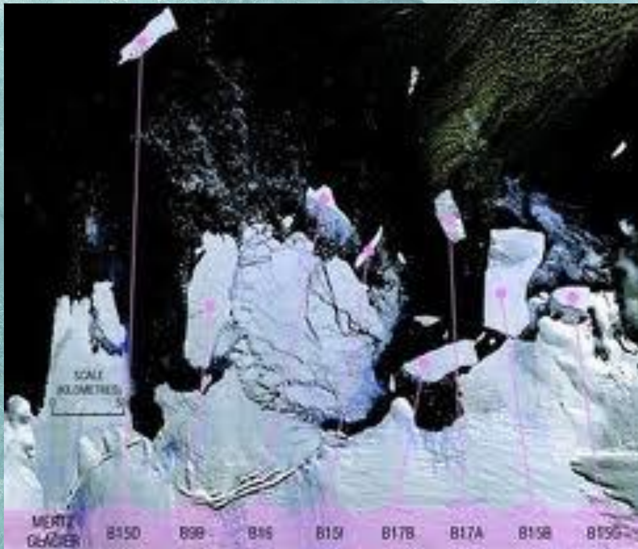
Айсберг со спутника