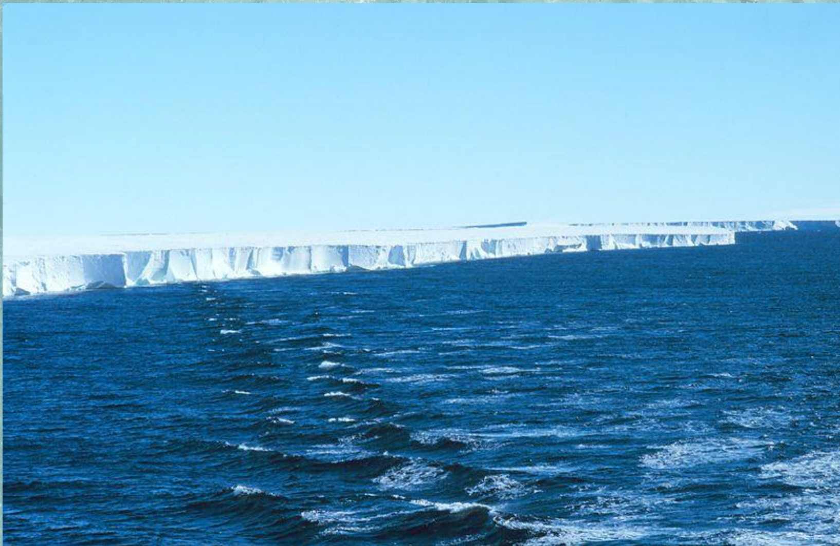
Шельфовый ледник Росса. Антарктида.

Более 99% всей площади ледников Земли принадлежит полярным областям.