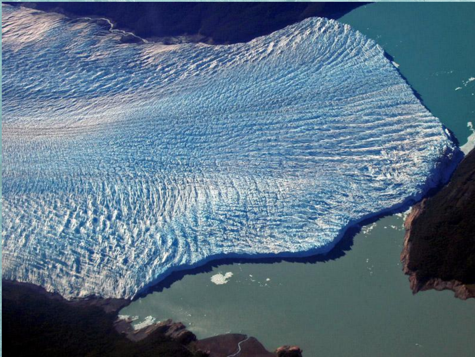
Ледник Перито-Морено, Аргентина