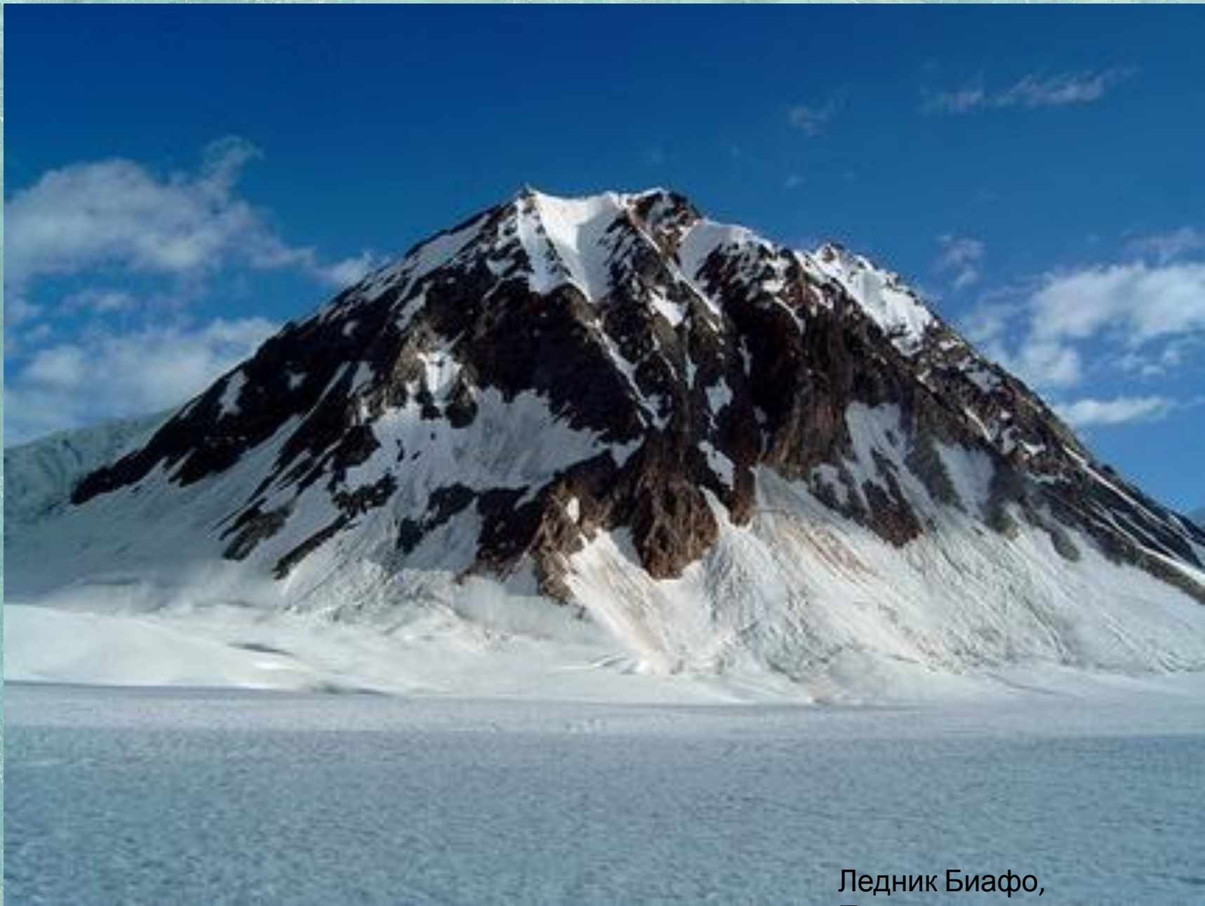
Ледник Биафо, Пакистан