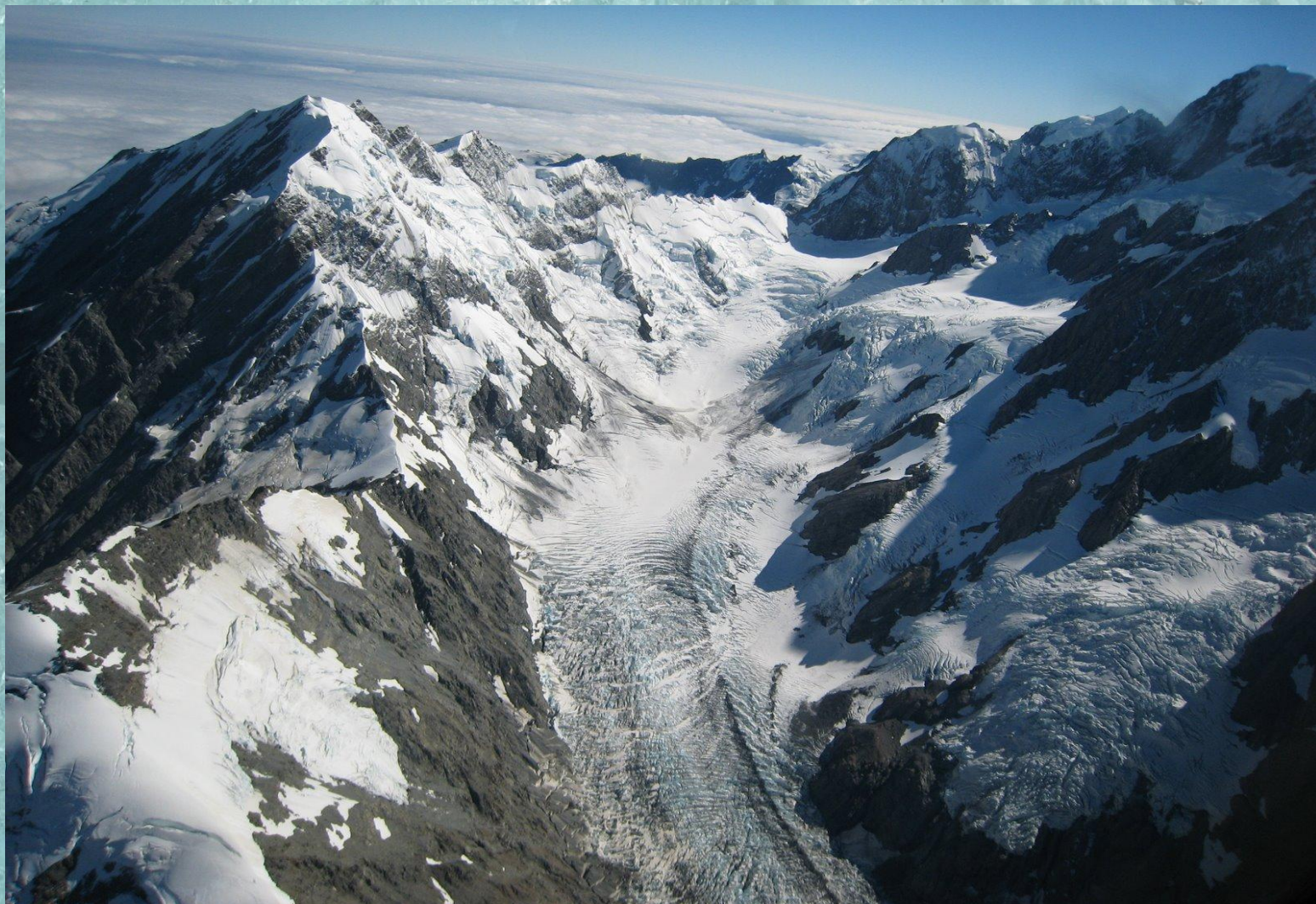
Ледник Тасмана. Новая Зеландия

Ледники — природные образования, представляющие собой скопление льда атмосферного происхождения.