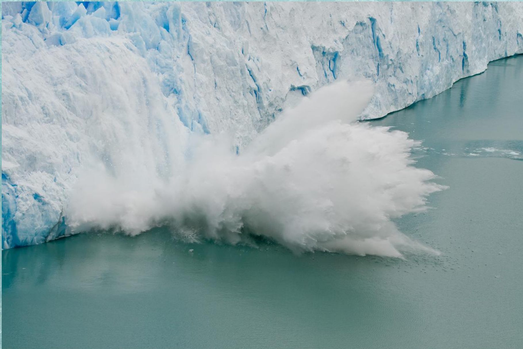
Айсберг откалывается то ледника