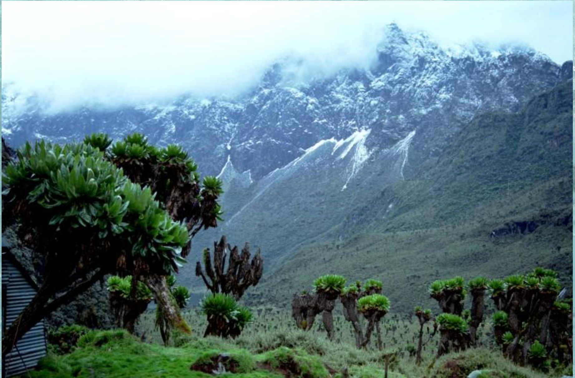
Горная цепь Рувензори. Уганда.