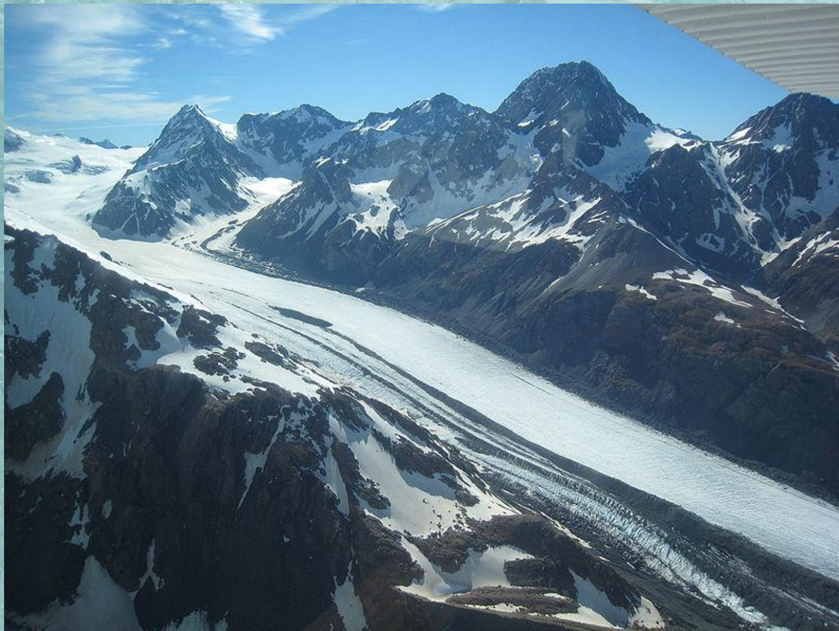
Ледник Тасмана. Новая Зеландия