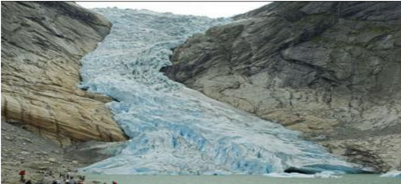
Рисунок 7. Ледниковый язык с озером