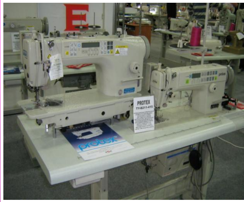
Швейная промышленная машина