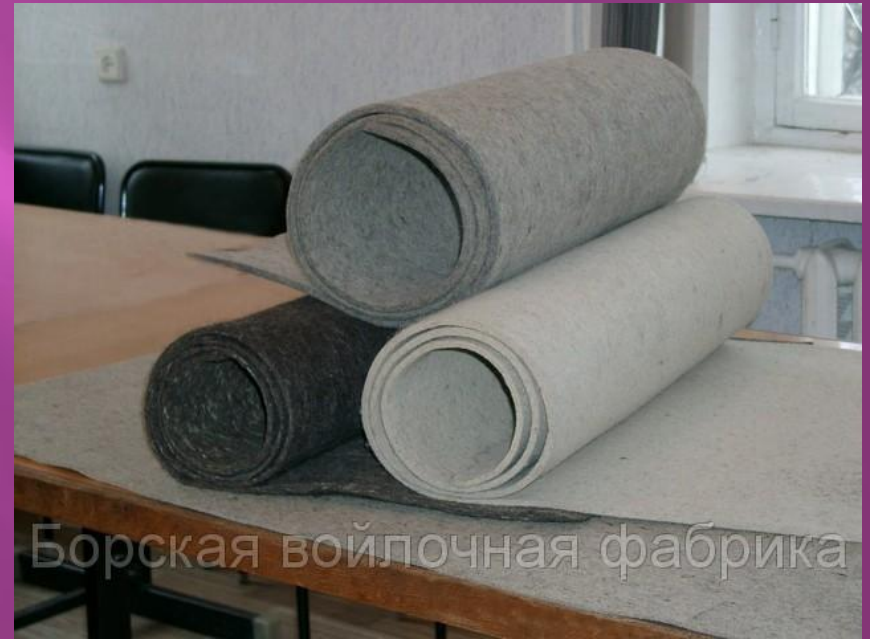
Борская войлочная фабрика