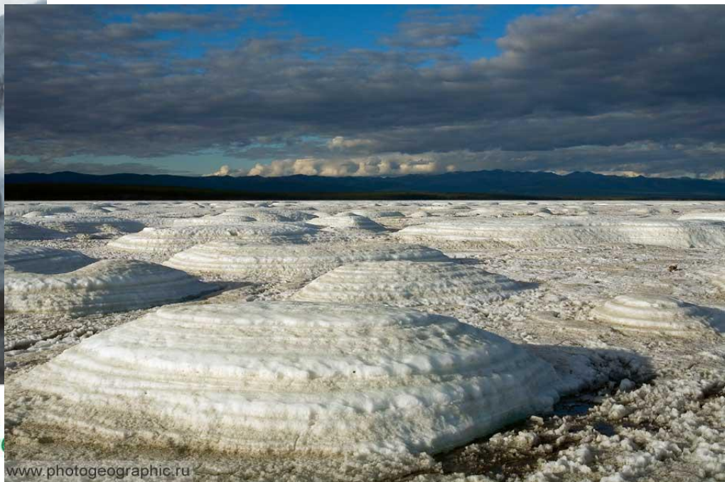
Большая Момская наледь