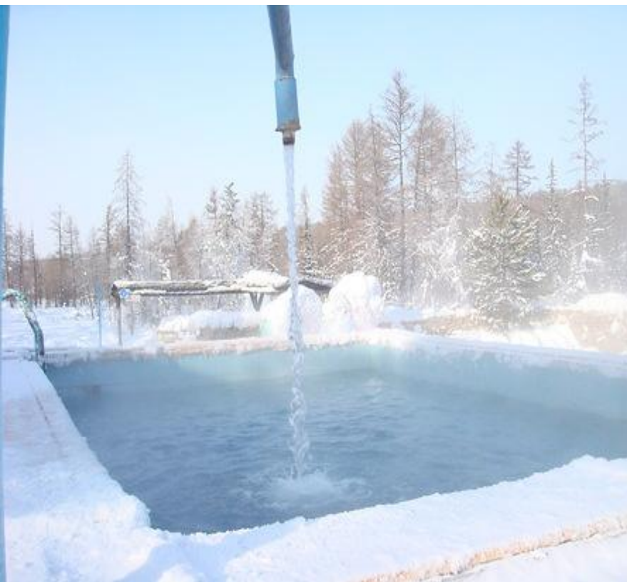
База отдыха «Нахот»