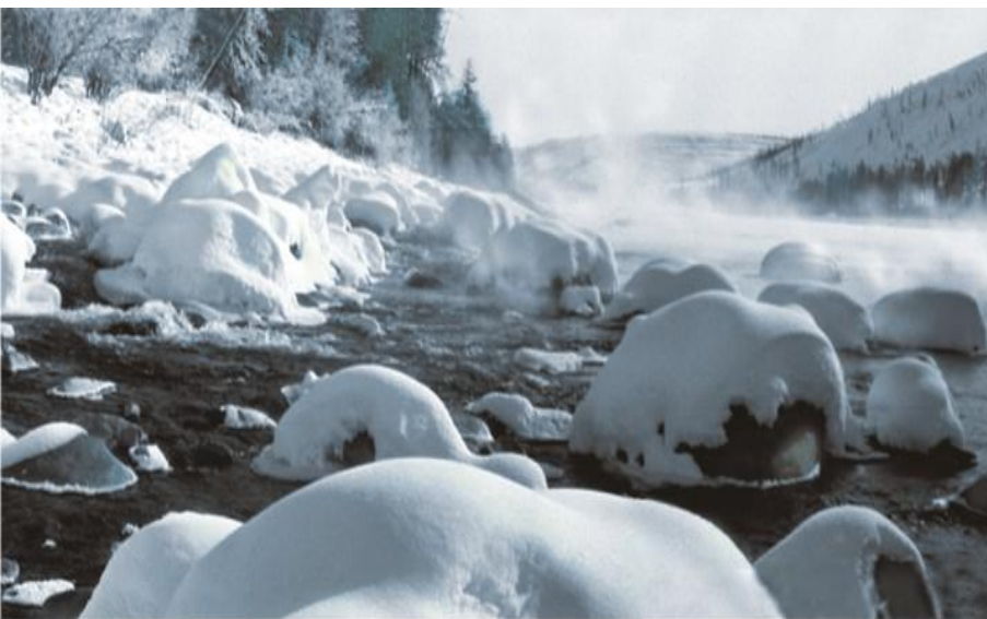
Общий вид Тимптонских родников в зимнее время.