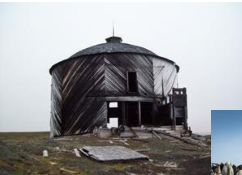
Исчезнувший поселок Нордвик