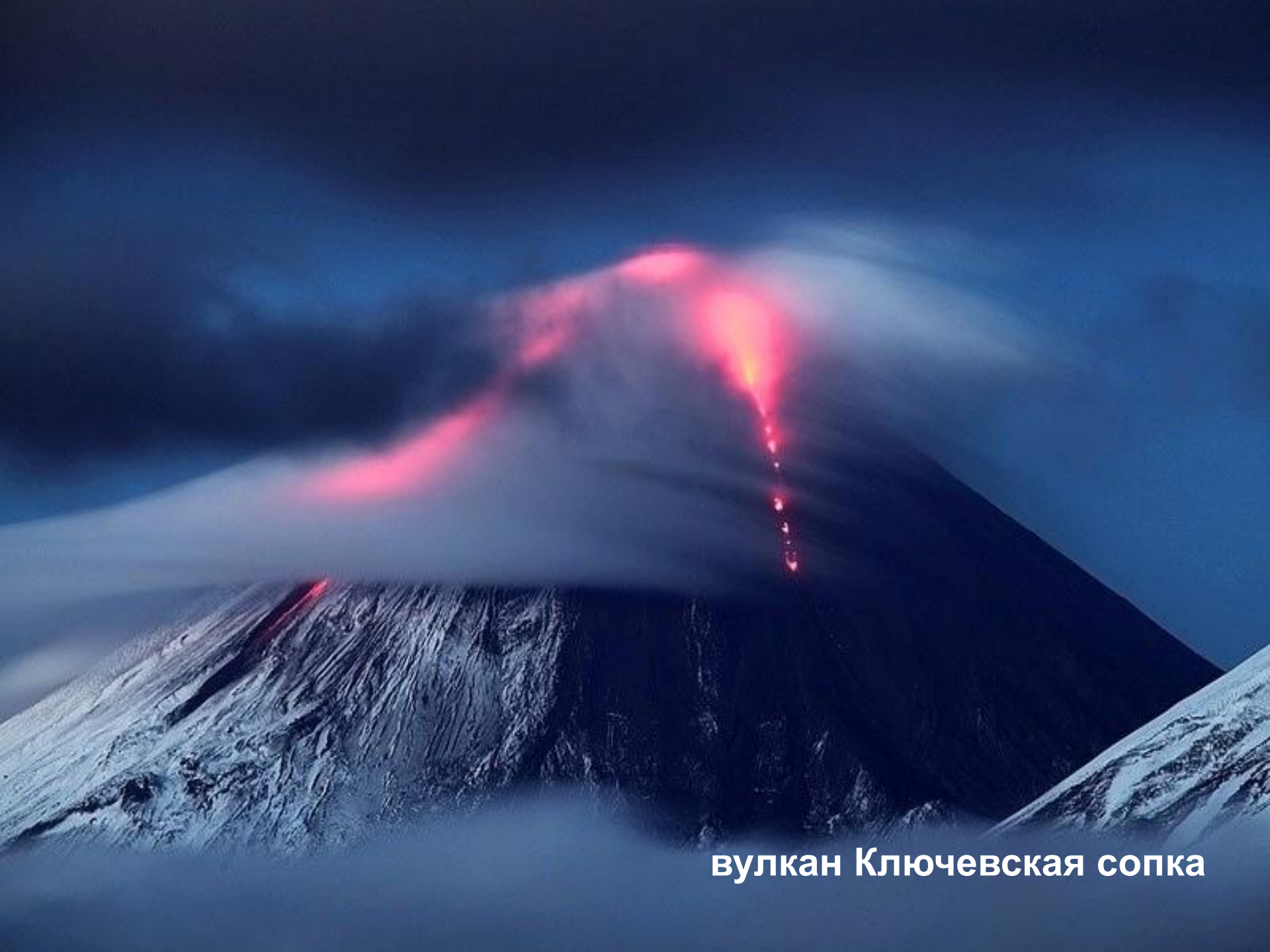
вулкан Ключевская сопка