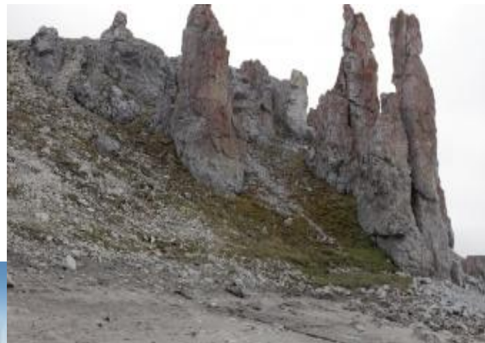
Каменный город, Таймырский заповедник