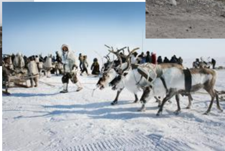
Этнотуризм – п. Хатанга