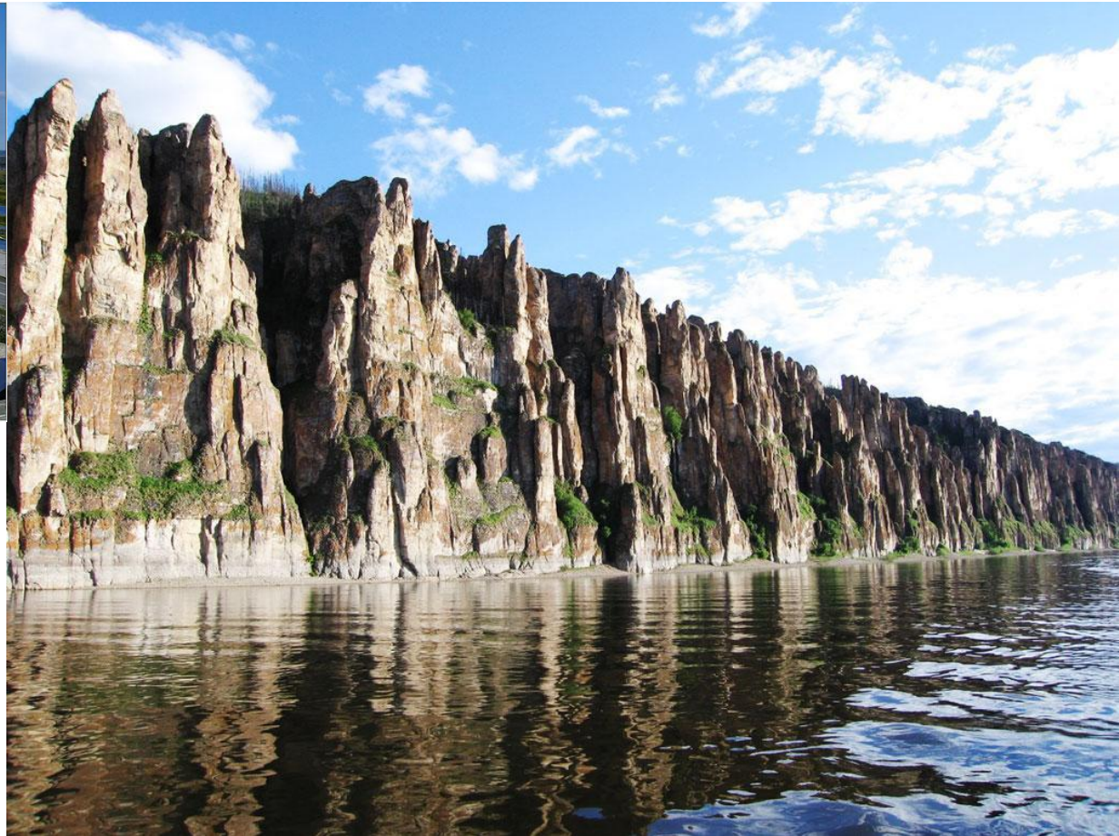
Парк Ленские Столбы (Список Юнеско)