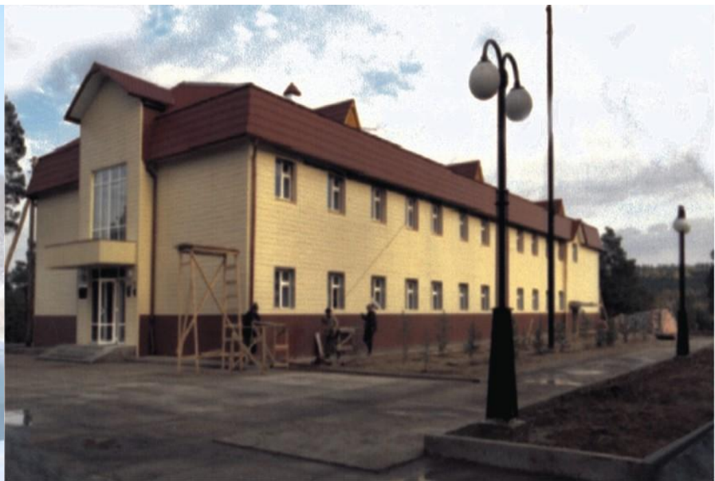
Здание главного корпуса курорта Кемпендйя (Сунтарский улус), где в качестве основного лечебного фактора используются минеральные подземные воды.

Источник Сытыган-Сылба – единственный выход термальных вод на поверхность