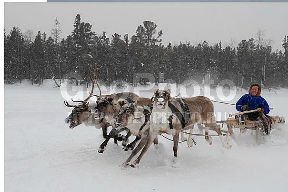
# stnh000005 Yanal region, spring festival of reindeering