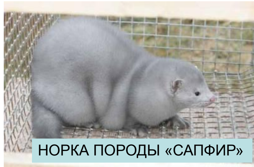
НОРКА ПОРОДЫ «САПФИР»