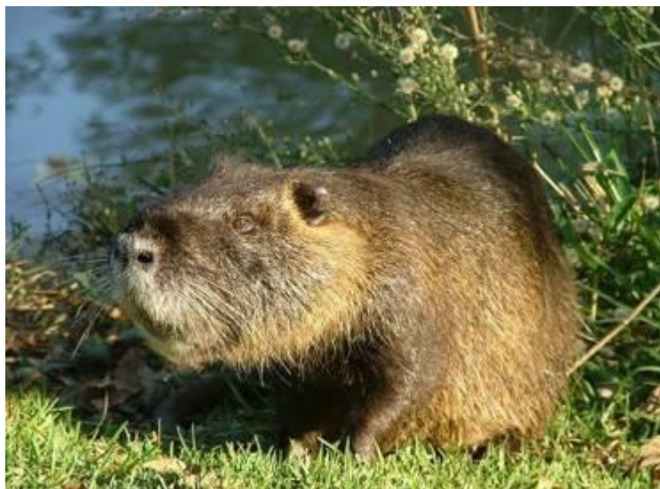
БОБР В ВЕРХНЕ-КОНДИНСКОМ ЗАПОВЕДНИКЕ