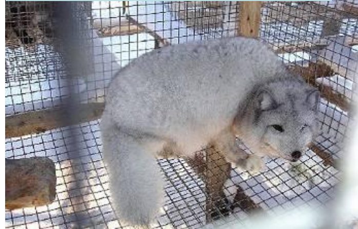
ПЕСЕЦ НА ЗВЕРОФЕРМЕ