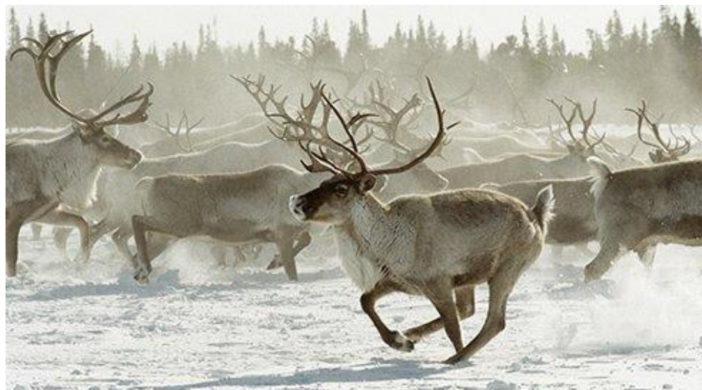
СТАДО СЕВЕРНЫХ ОЛЕНЕЙ В ТУНДРЕ