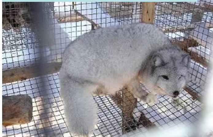
ПЕСЕЦ НА ЗВЕРОФЕРМЕ