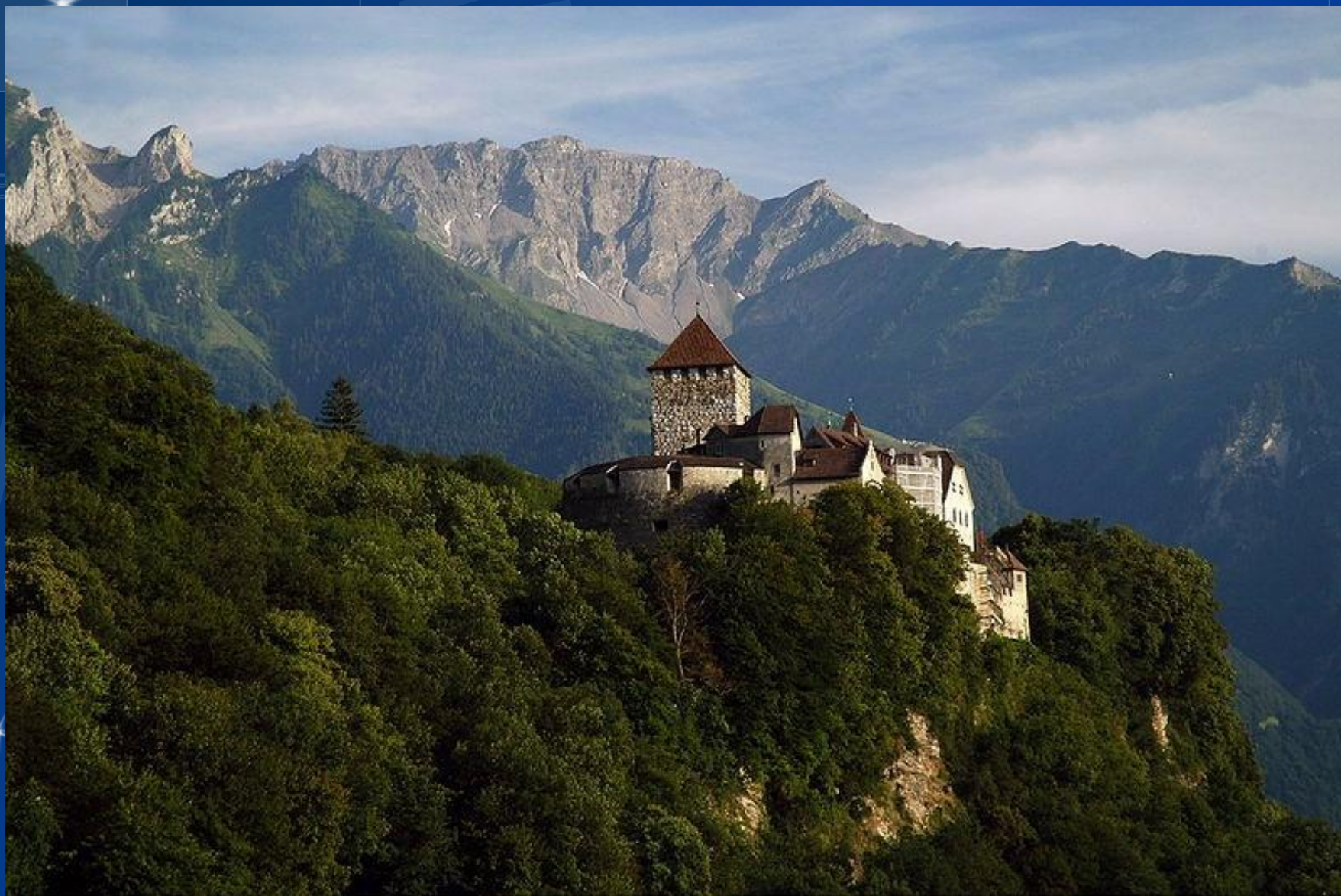
Замок Вадуц, возвышающийся над столицей Лихтенштейна.