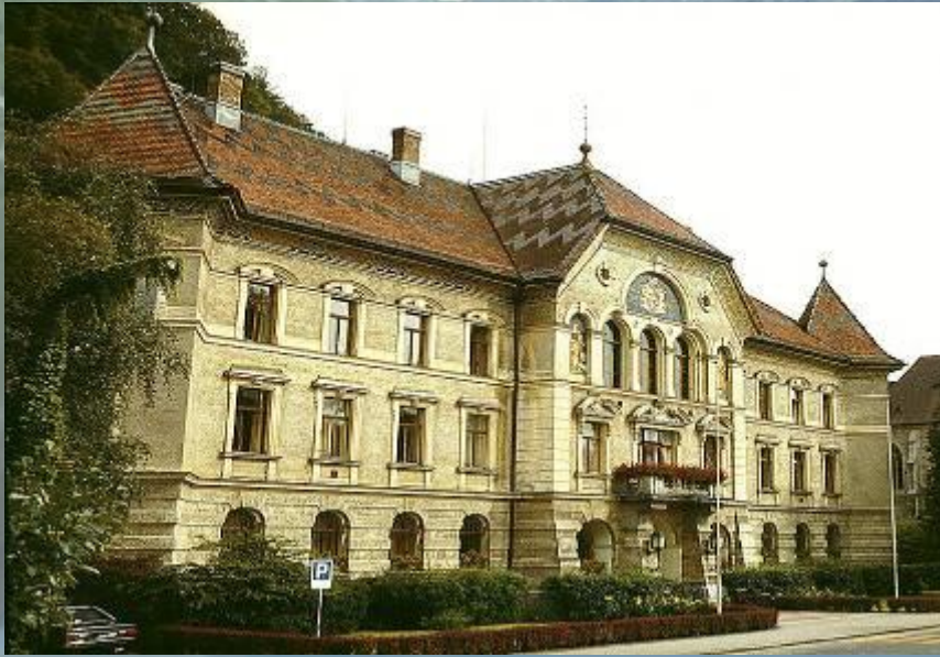
Здание правительства и парламента.

Лихтенштейн — конституционная монархия. Действующая конституция вступила в силу 5 октября 1921 года. Глава государства — Ханс-Адам II, князь фон унд цу Лихтенштейн, герцог Троппау и Егерндорф, граф Ритберг.