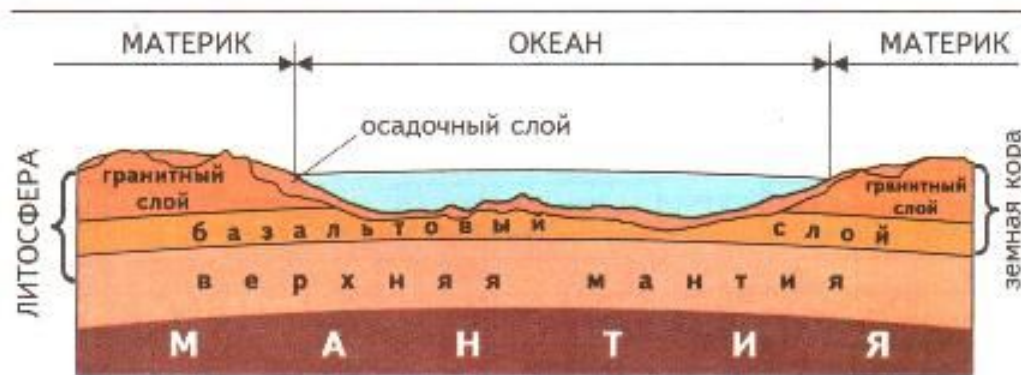
Рис. 1. Строение земной коры.

Земная кора и верхняя часть мантии, обладающая свойствами твердого тела, составляют литосферу