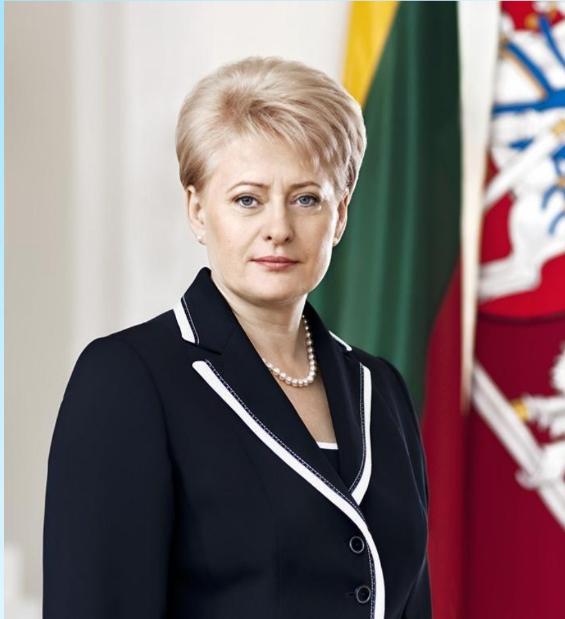
Д.Грибаускайте (с 2009 года)