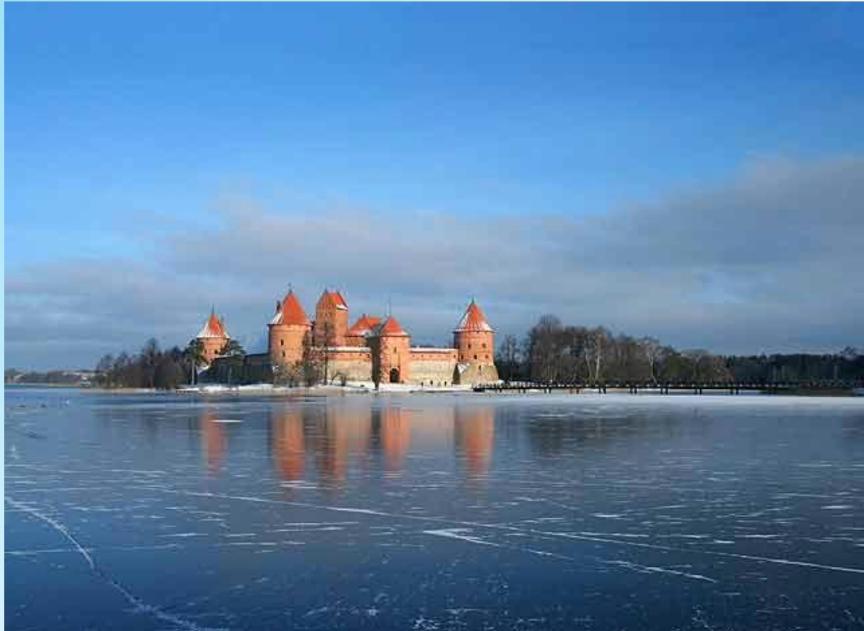
Тракайский Замок Литвы