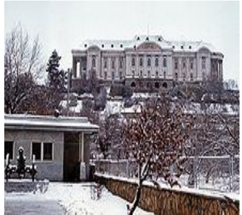
Дворец Амина после штурма советским спецназом ГРУ