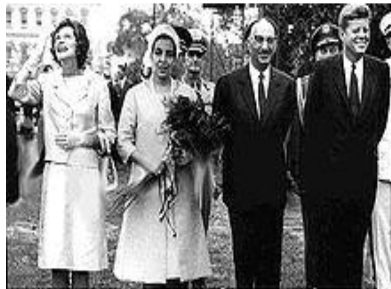
Король Афганистана Захир-шах и его жена с президентом Джоном Ф. Кеннеди и его женой Жаклин Кеннеди