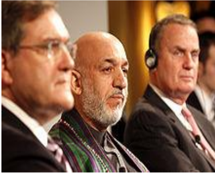
Президент Афганистана Хамид Карзай в Германии с Францом Жосефом Джунгом (справа) и Джеймсом Джонсоном (слева)

В конце 2001 года Совет Безопасности Организации Объединенных Наций санкционировал создание Международных сил содействия безопасности (ИСАФ). Это подразделения в составе войск НАТО , которые участвуют в оказании помощи правительству президента Хамида Карзая, а также восстановлению ключевой инфраструктуры в стране.