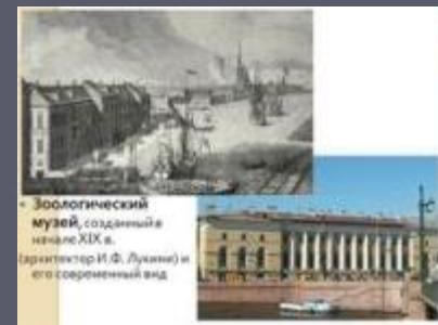
Зоологический музей, созданный в начале XIX в. (архитектор И.Ф. Лукман) и его современный вид