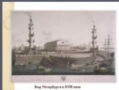
Вид Петербурга в XVIII веке

В память о великом ученом в здании Кунсткамеры (в первом ярусе башни) был открыт (в 1949) музей М. В. Ломоносова. В музее воссоздана обстановка конференц-зала Академии наук, представлены личные вещи ученого.