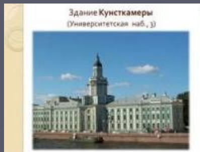
Здание Кунсткамеры (Университетская наб., 3)