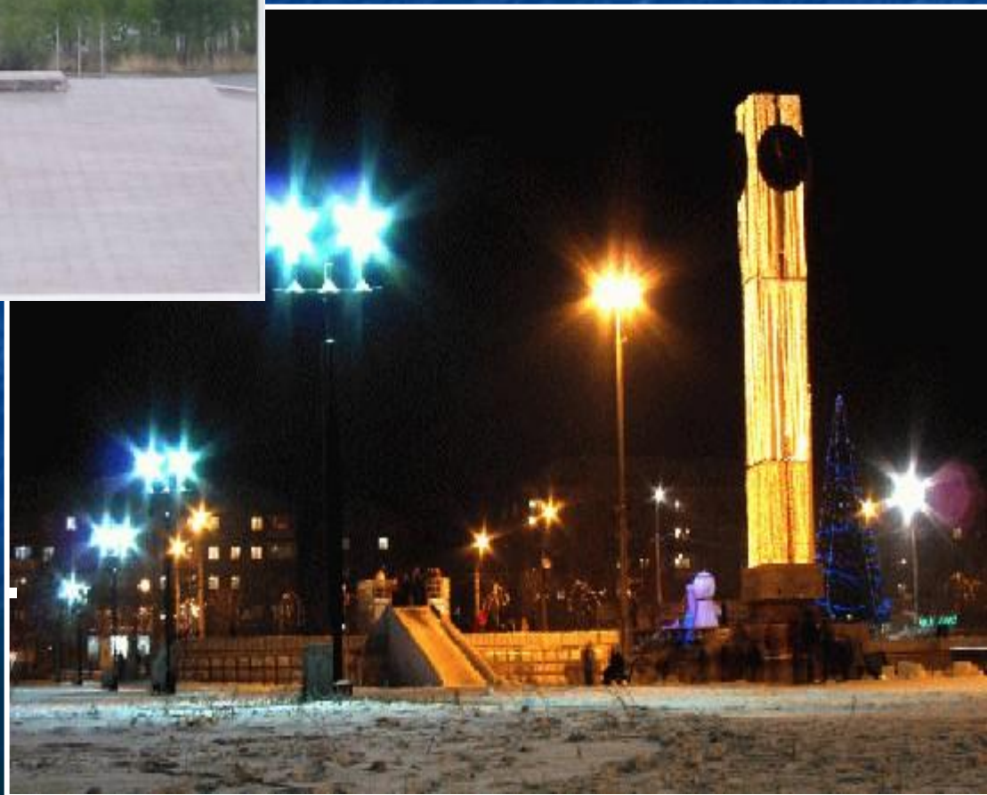
Вторая - площадь Народных гуляний