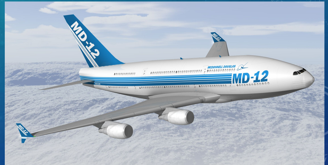
McDonnell Douglas- самолет США