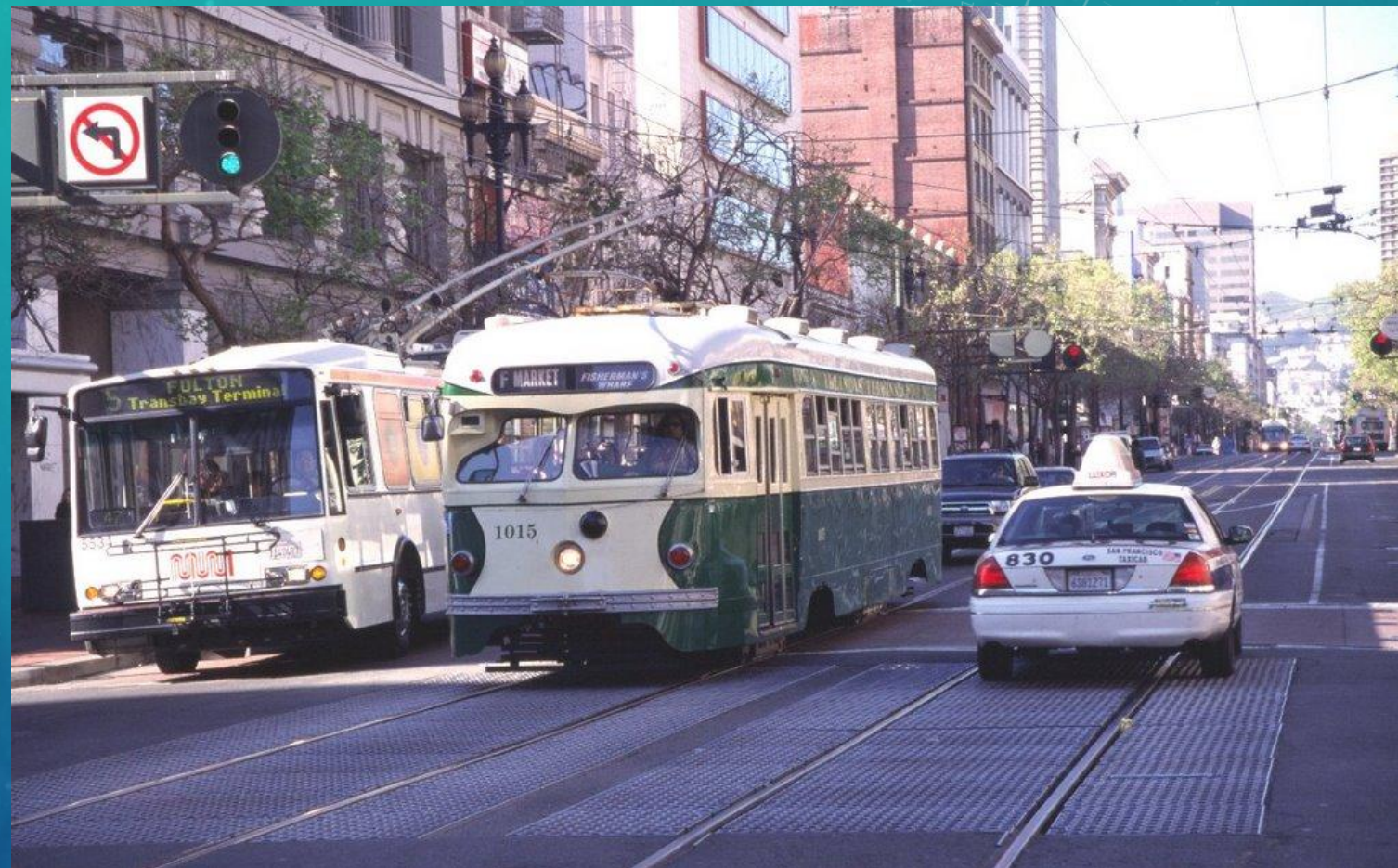
Общественный транспорт (троллейбус и трамвай) и такси в Сан-Франциско