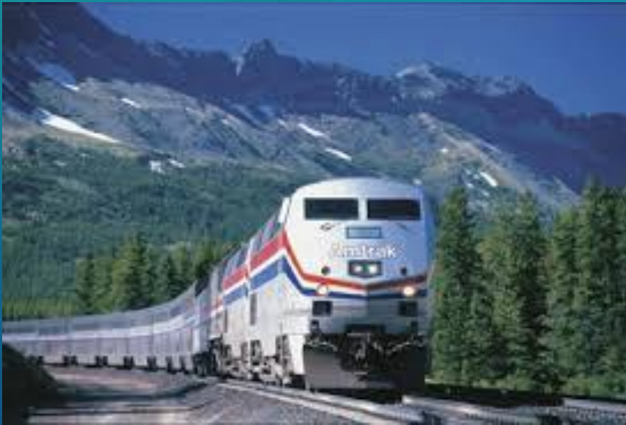
Amtrak- поезд США