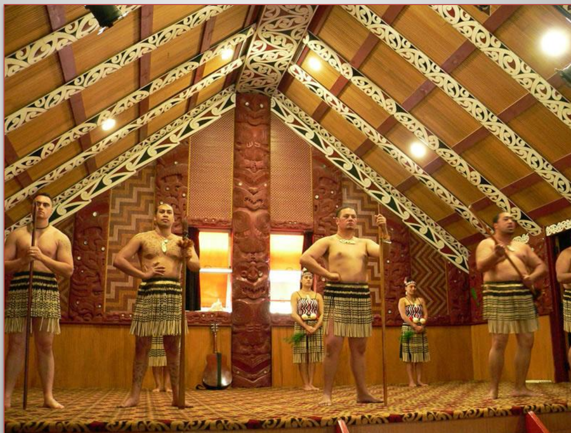
выступление маори в наши дни

Всемирную популярность сегодня завоевывает знаменитый боевой танец маори, название которого звучит как «хака». В настоящее время за племенами маори закреплено авторское право на этот танец, а правительство Новой Зеландии официально предоставило членам племени право собственности на боевой клич «Ка мате». По сути хака – это ритуальный танец, сопровождаемый хоровой поддержкой или периодически выкрикиваемыми словами. Исполнялся он для призыва духов природы или перед вступлением в бой с противником. Существует также другой вид танца, исполняемый женщинами, — так называемый пои