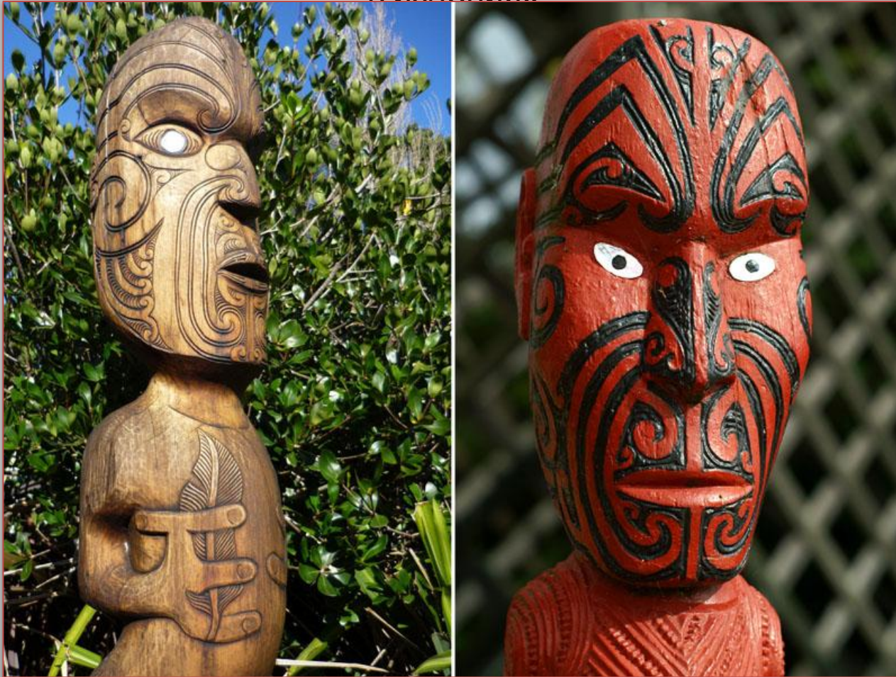
ремесленное творчество народа Маори

Ремесленное производство зародилось в культуре с самых давних времен и до сих пор является важной составляющей их жизни. Ключевыми ремеслами маори являются резьба по дереву, ткачество, строительство лодок, плетение, создание украшений. Удивительной чертой ремесленного творчества maori является отсутствие изображений или фигурок животных в изделиях