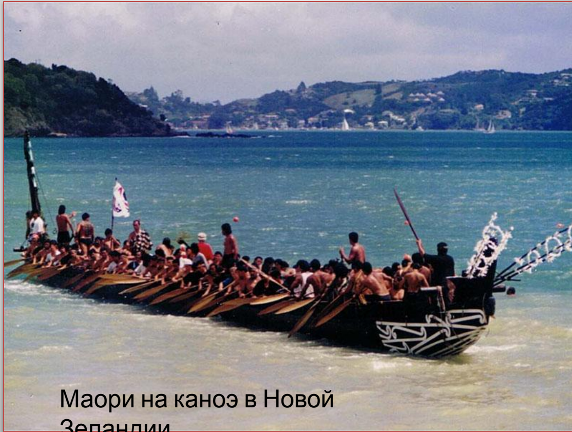
Маори на каноэ в Новой Зеландии

Маори – коренное население Новой Зеландии, представители которого являлись главными жителями островов до прибытия на эти земли европейцев. В мире насчитывается около 680 тысяч представителей этого народа. Помимо государства Новая Зеландия странами, в которых живут маори, являются Австралия, США, Канада, Великобритания и некоторые другие государства.