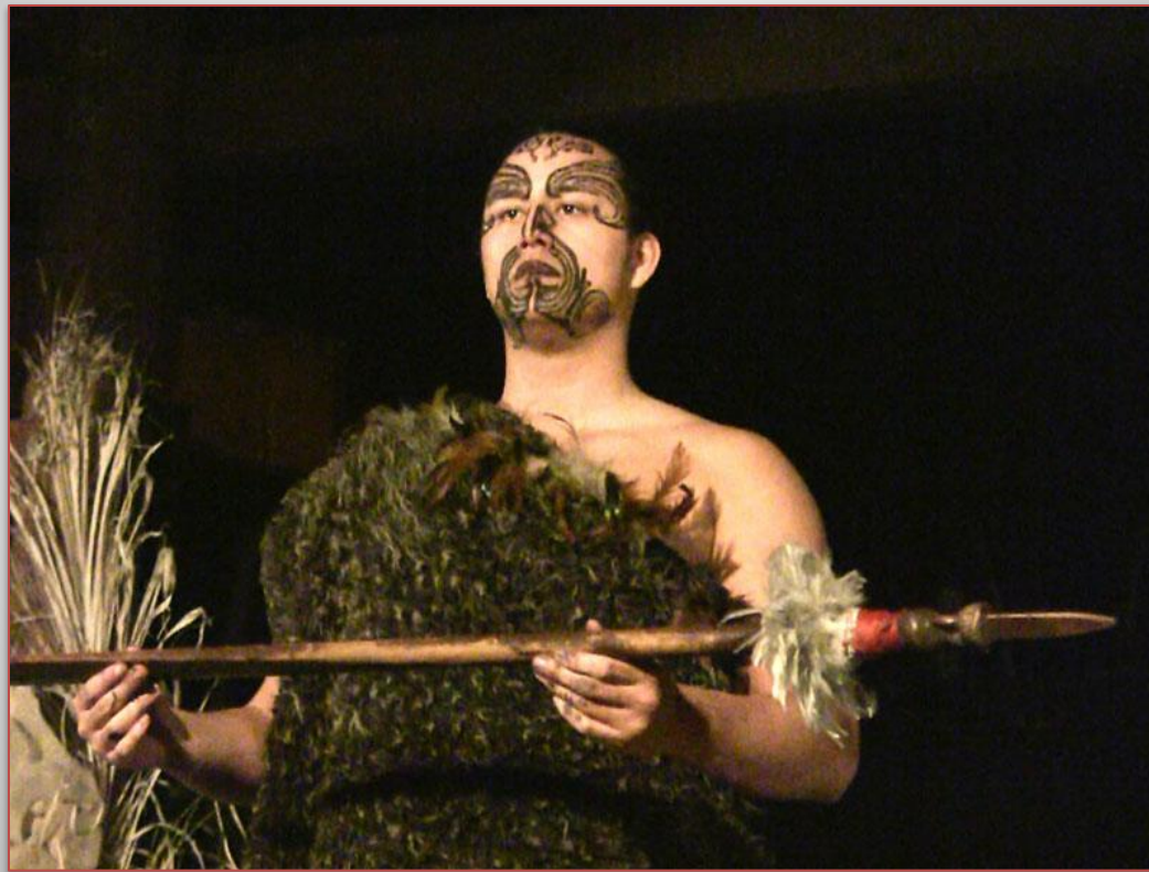
воин маори с оружием в руках

Маори являлись одним из самых жестоких и выносливых народов древнего мира. Их традиции и некоторые представления о жизни современному человеку могут показаться дикими и далекими от гуманности и доброты. Например, типичным явлением для маори был каннибализм – в прошлые века они съедали своих пленных. Причем делалось это с верой в то, что сила съеденного врага непременно перейдет к тому, кто его съедает.