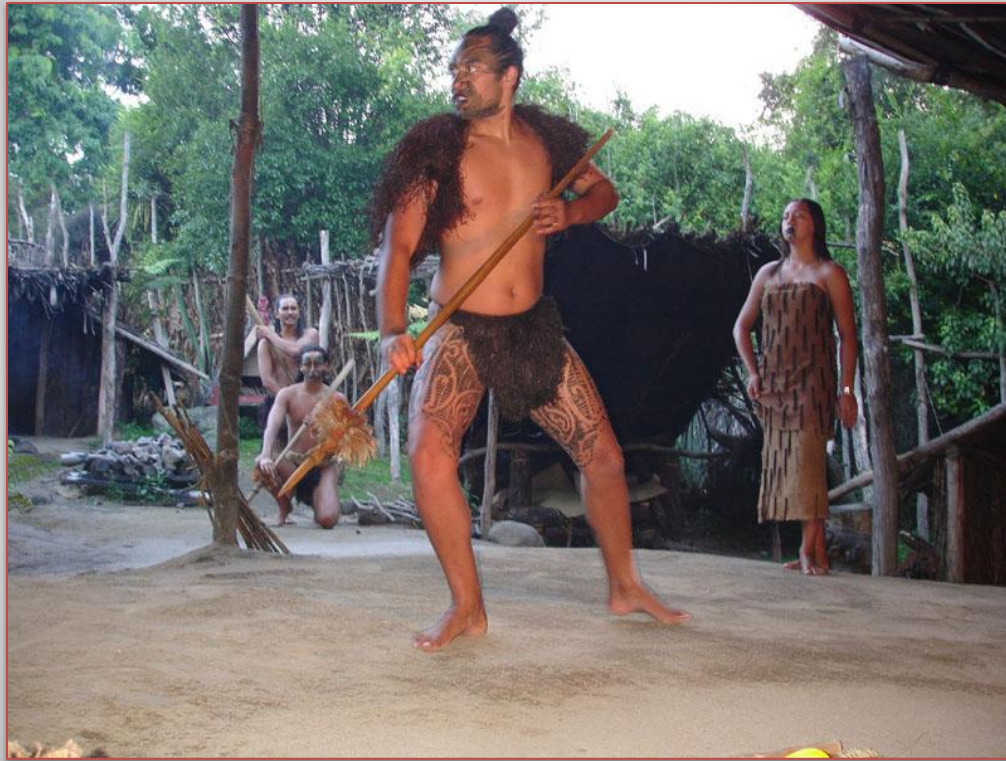
в деревне маори

Отличие климата от Гавайев или Таити также стало причиной появления у маори более теплой одежды. Традиционными для этого народа были накидки и плащи, у женщин – длинные юбки. Для утепления ткани (обычно льна) в нее вплетались шкурки животных (собак) и перья птиц