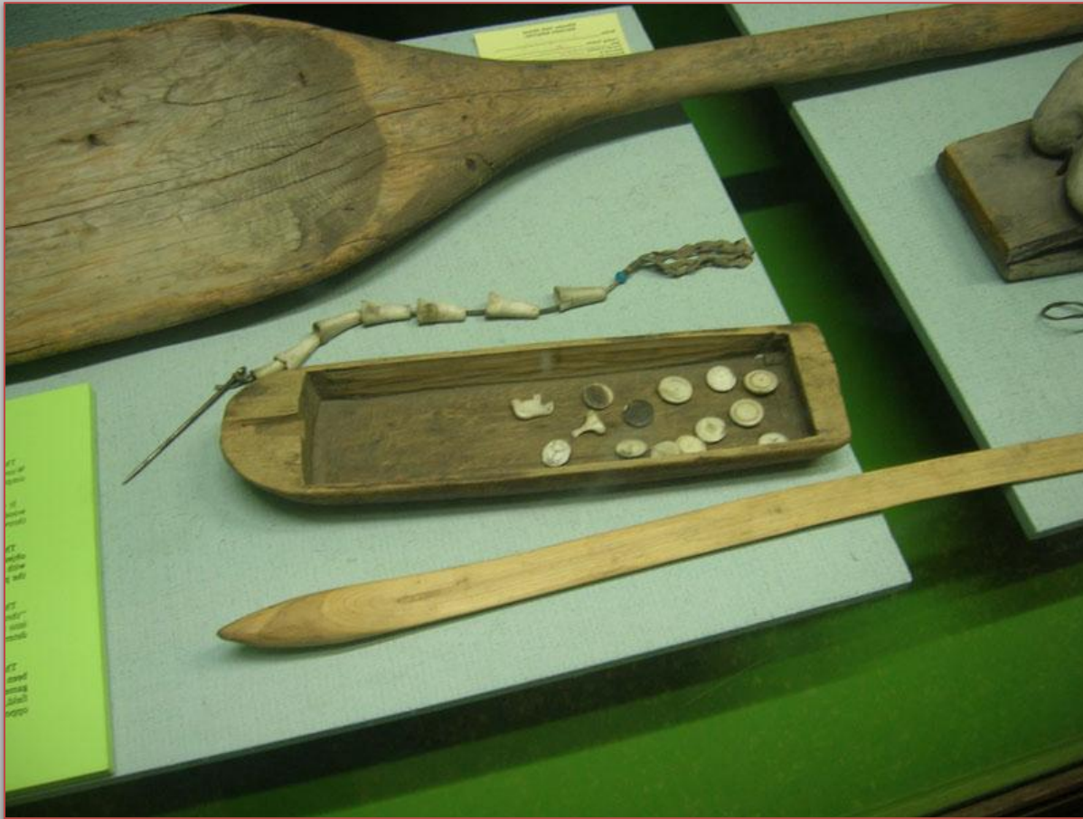
предметы обихода маори

Маори научились изготавливать различные виды оружия – дротик (хуата), шест, копье (кокири), своеобразное укороченное штыковое орудие (таиаха), палицу (мере), при возделывании земли главным инструментом являлась палка-копалка, в охоте большое распространение получили силки.