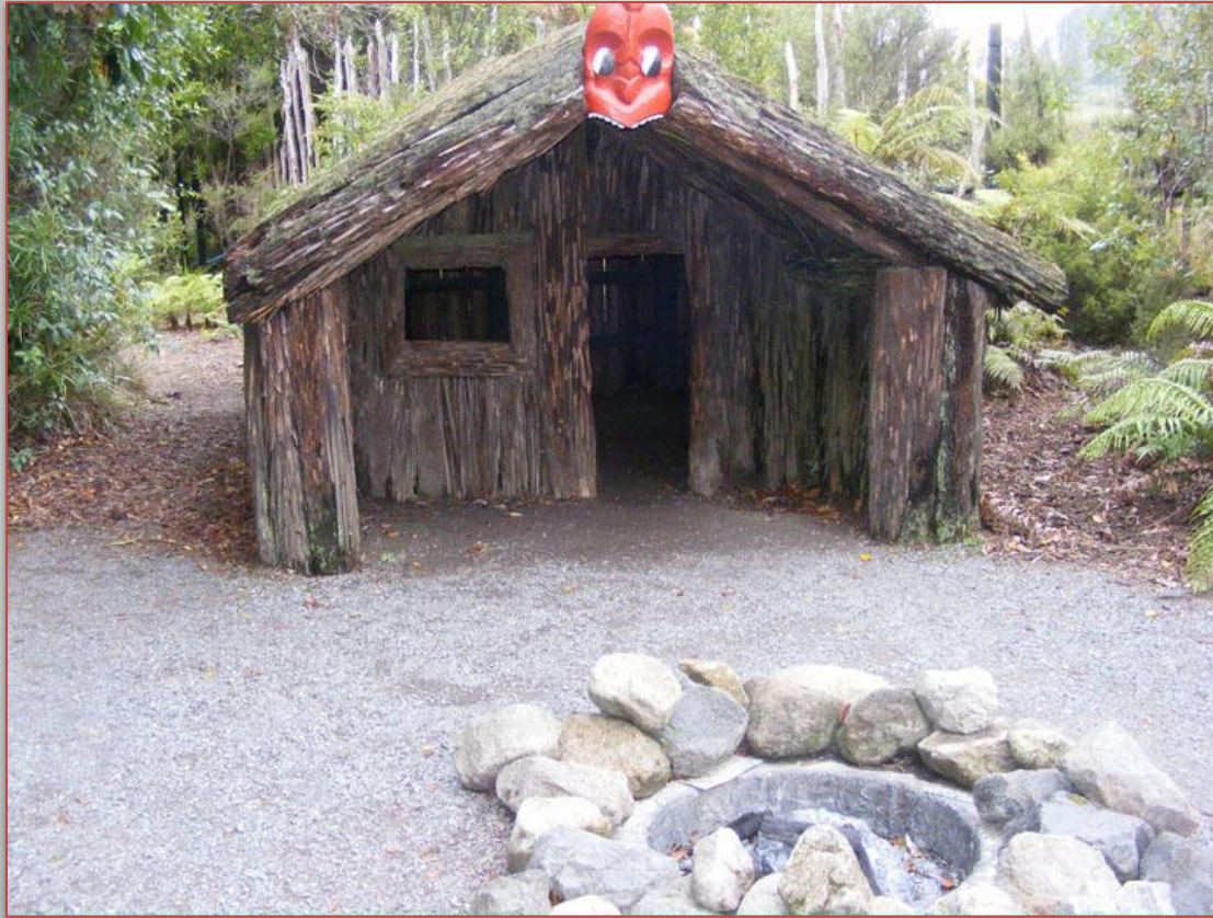
традиционное жилище маори в Новой Зеландии

Деревня (па) – традиционное поселение маори – раньше представляла собой компактное пространство, окруженное рвом или деревянной оградой, внутри которого находились жилые дома (фаре). Дома строили из досок и бревен, крышу делали из соломы, а пол был углубленным в землю, поскольку из-за более прохладного климата дома нуждались в утеплении.