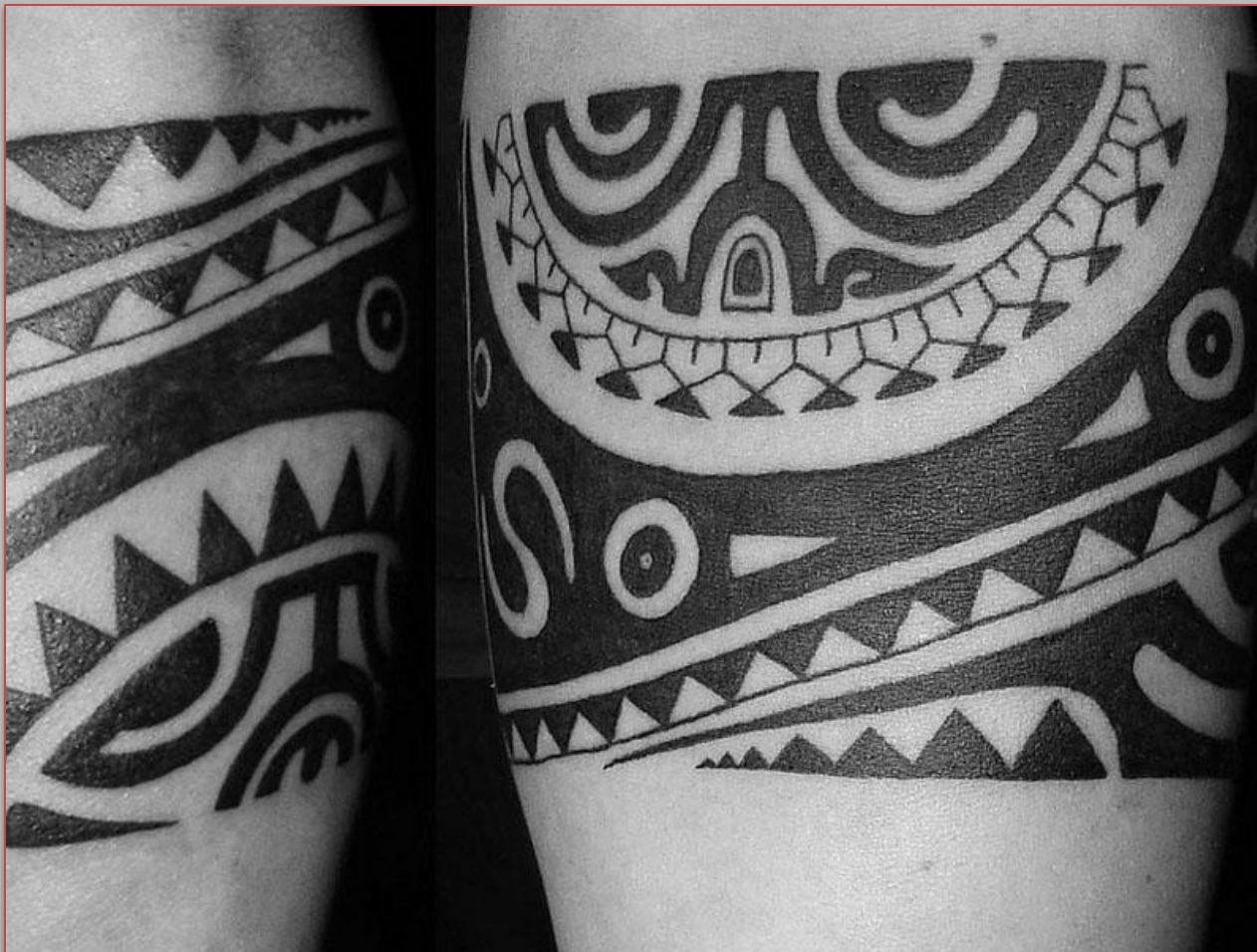
орнамент татуировки народа маори

Другой традицией являлось нанесение самого болезненного вида татуировки – мокко, отражающей статус человека в обществе.