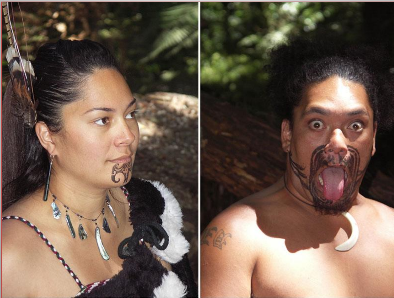
женщина и мужчина маори (Новая Зеландия)

Женщины с помощью тату украшали подбородки и губы, мужчины-воины покрывали такими узорами все лицо. Причем рисунок наносился не простыми иголками, а маленькими резцами, подобно тому, как скульптор ваяет свои творения.