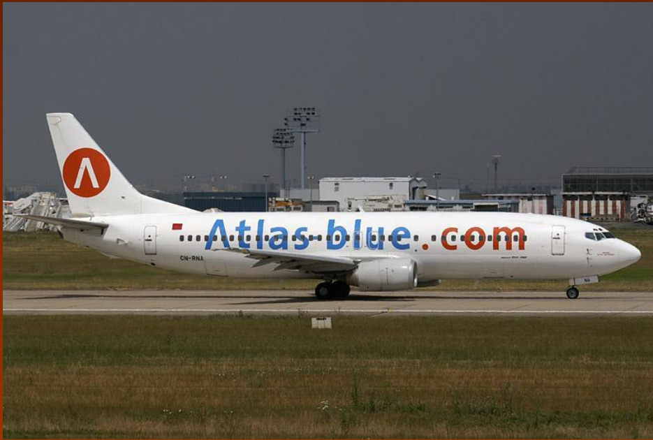
Boeing 737—400 компании Голубой Атлас