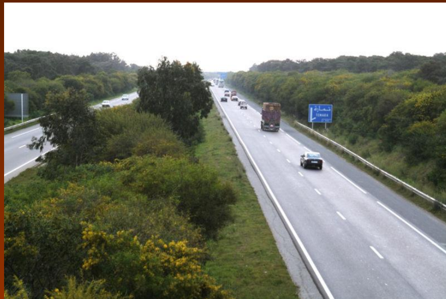
Автодорога А3 Касабланка — Рабат в Марокко