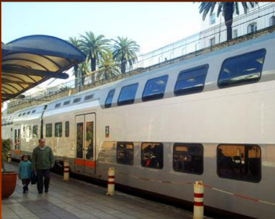
Двухэтажный вагон поезда на одной из станций в Марокко