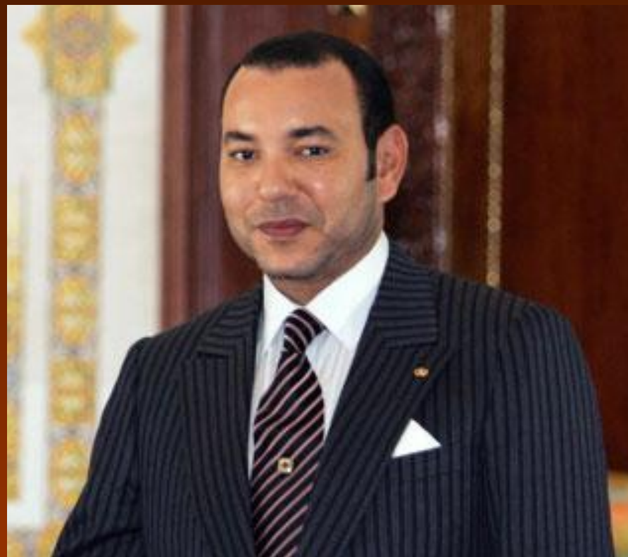
Король Мухаммед VI