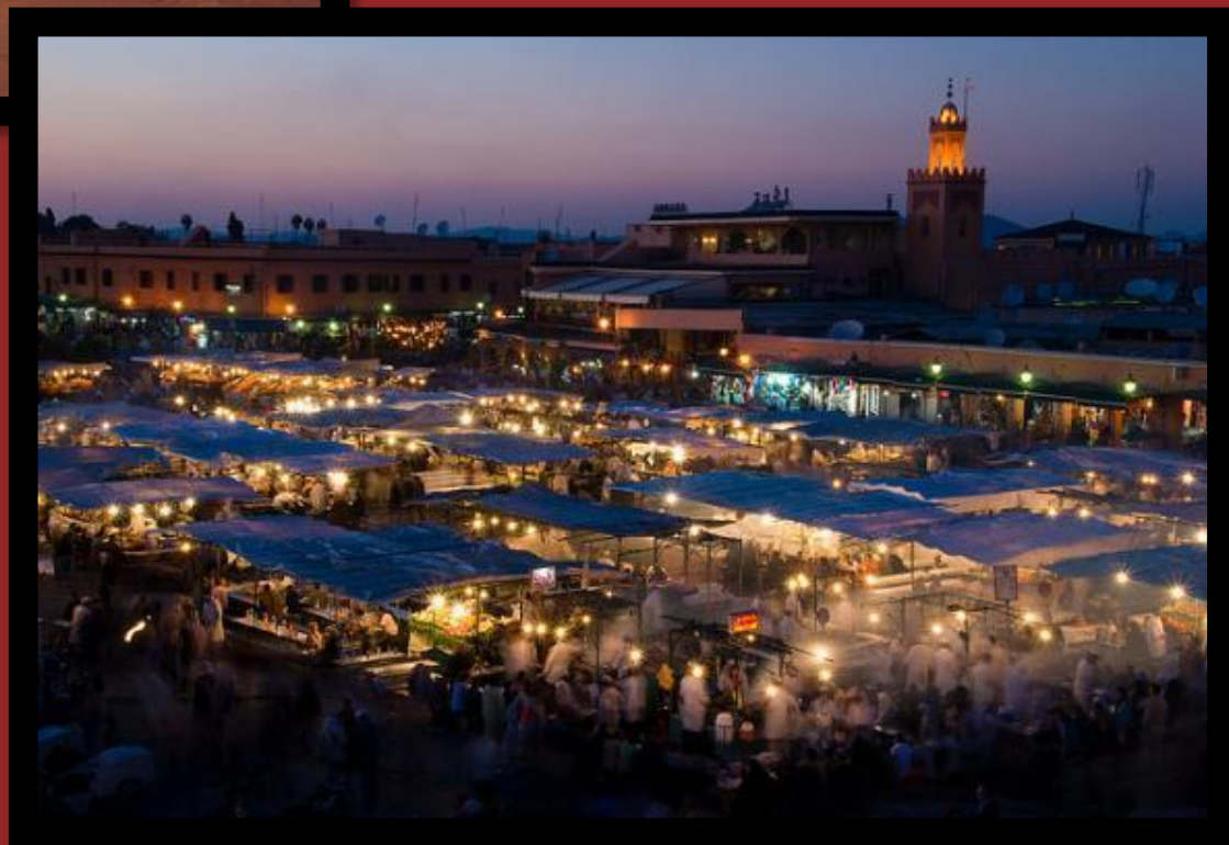
Площадь Джема-эль- Фна